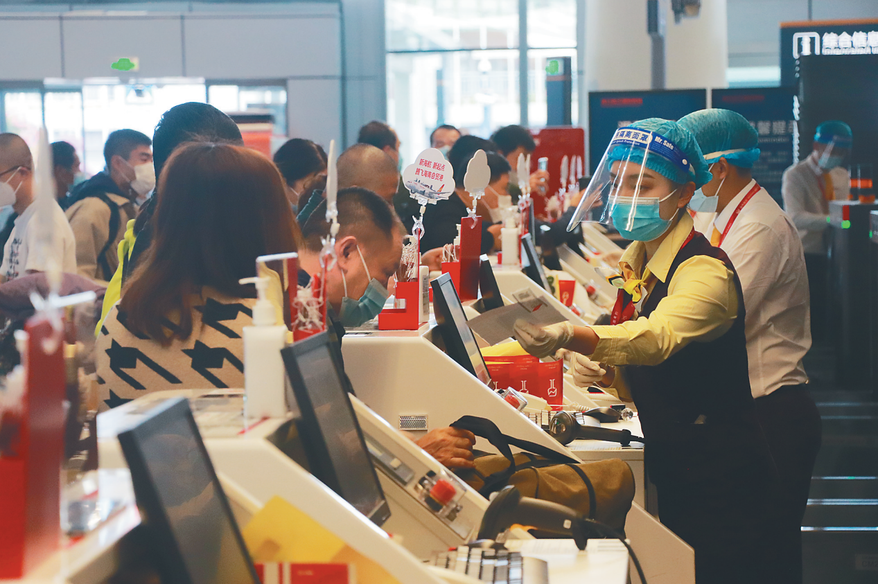
春节期间海南航空为旅客办理乘机手续。