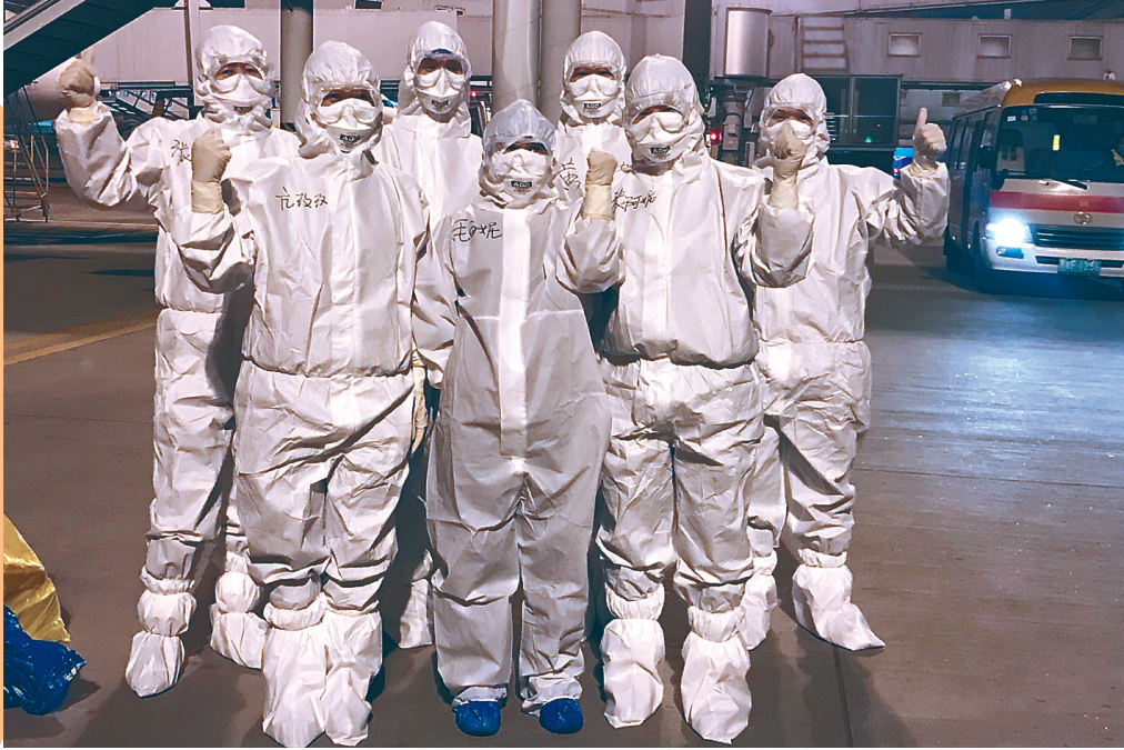
长安航空地服员工执行国际分流航班保障任务。

哪里有党组织,哪里就有战斗力,哪里党建抓得实,哪里就有蓬勃朝气。在辽宁方大集团“党建为魂”的企业文化引领下,海航航空深入开展党史学习教育,大力加强基层党组织建设,在党建工作“走深走实走心”上持续用力。