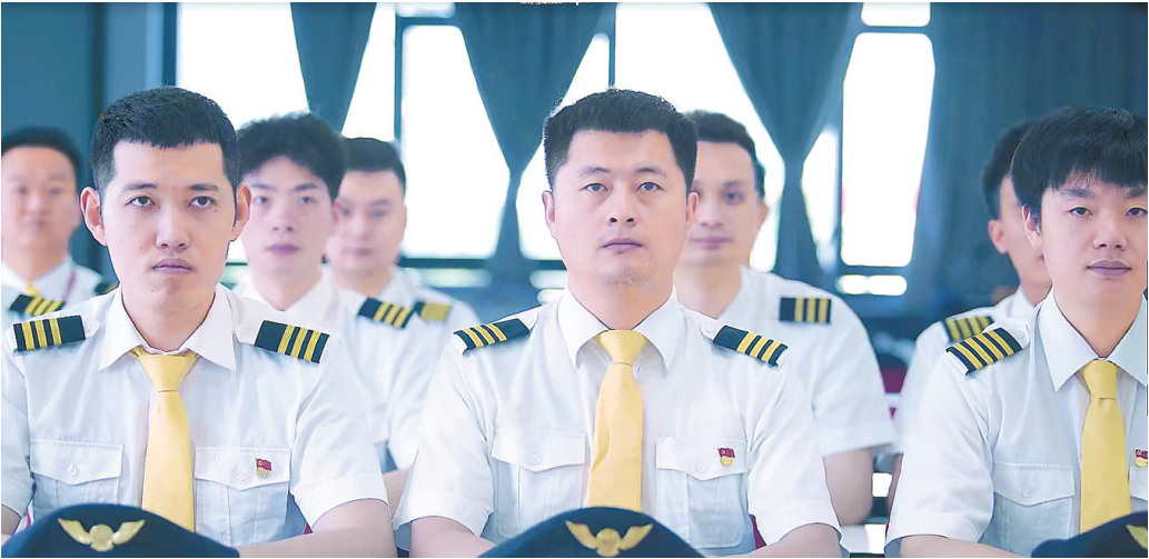
西部航空渝鹰班组。