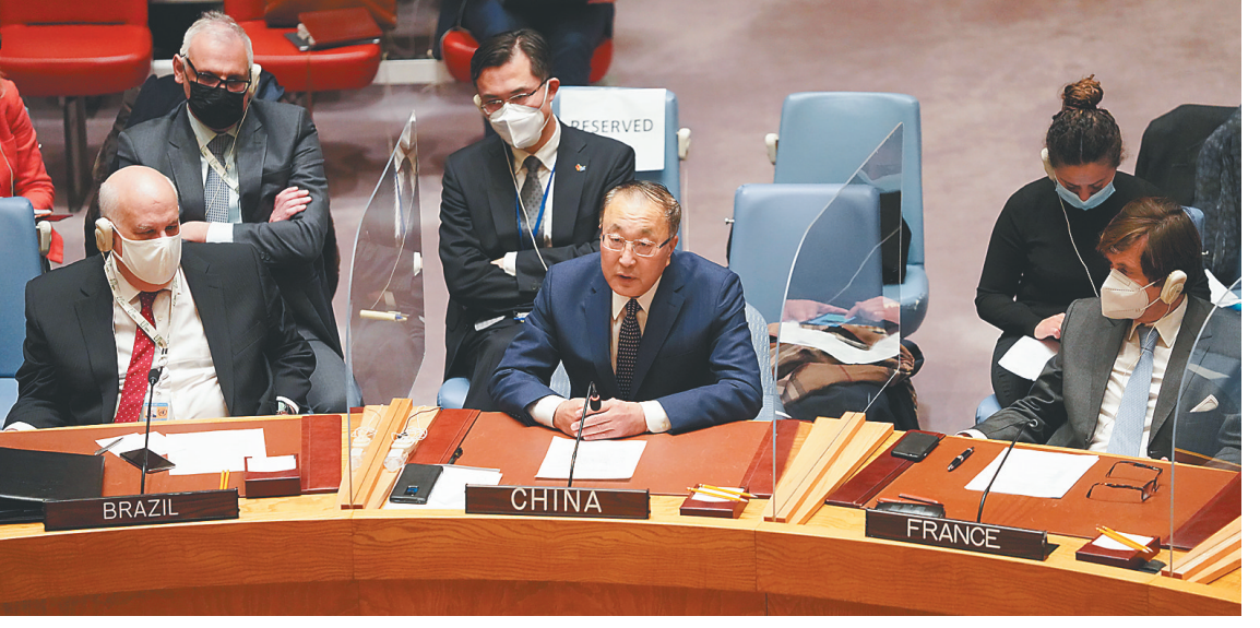
2月21日,中国常驻联合国代表张军(前中)在安理会举行的审议乌克兰问题紧急会议上发言。

敦促相关各方立即停止敌对行动,保护平民和民用基础设施,防止任何可能使局势升级的行动和言论,并优先开展外交活动,和平解决所有问题。 联合国安理会当地时间21日21时就乌克兰问题召开紧急会议。联合国负责政治事务的副秘书长罗斯玛丽·迪卡洛在会上重申了古特雷斯的立场,强调在当前形势下,坚持对话更加重要,谈判是解决地区安全问题和乌克兰东部问题的唯一出路。 中国常驻联合国代表张军在会上表示,乌克兰局势发展到目前状况,是一系列复杂因素共同作用的结果。中国一贯按照事情本身的是非曲直决定自身立场,主张各国根据联合国宪章的宗旨和原则,和平解决国际争端。中方呼吁有关各方继续开展对话协商,在平等和相互尊重的基础上寻求解决彼此关切的合理方案。 美国总统拜登当地时间21日签署一项行政令,就俄方上述举动作出回应,要求禁止美国人在这两个地区开展新的商贸活动。白宫新闻秘书珍·普萨基发表的声明说,这项行政令禁止美国人在上述两个地区进行新的投资、贸易和融