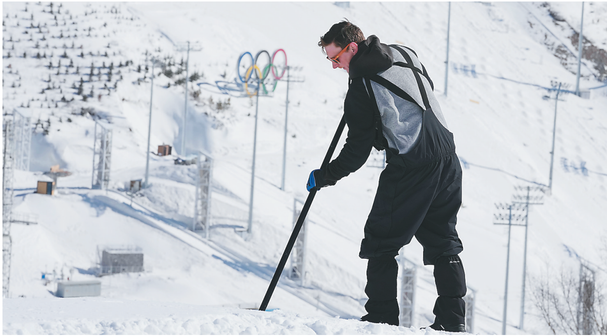
二月二十五日,工作人员在北京冬残奥会张家口赛区云顶滑雪公园整理赛道。

两天。 “针对冬残奥会的比赛要求,需要缩短赛道长度,降低出发的起点位置,降低赛道难度。我们大约还需要三天时间来做调整塑形工作。”他说,“工作是辛苦的,但是想起冬残奥会运动员,就为我们带来了精神力量。” 为保障运动员顺利参赛,云顶场馆群设置了矫形器、假肢与轮椅维修中心。来自德国的维修技术人员朱利安·纳普和几位同事将一起在维修中心提供服务。“因为疫情的原因,北京冬残奥会期间我们可能需要在与运动员保持一定距离的情况下下提供服务,但我们已经做好了充分准备,为运动员现场提供最快的服务。”他说。 “无碍”只是起点,云顶滑雪公园的转换期工作处处充满了“有爱”的细节:在比赛出发区为运动员增设了取暖棚和卫生间,让他们可以放心舒适地参赛;增设低位服务台、升降机和无障碍车辆等设施,让前来云顶的人在每一处场所都能感受贴心和顺畅;还为媒体设置了低位护栏采访区,为需要使用轮椅的记者提供无障碍的采访环境。 对于云顶滑雪公园这个地势落差