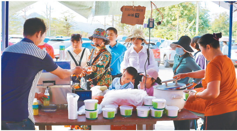
在昌江七叉镇宝山梯田木棉景区，附近村民拿出自家农产品售卖。