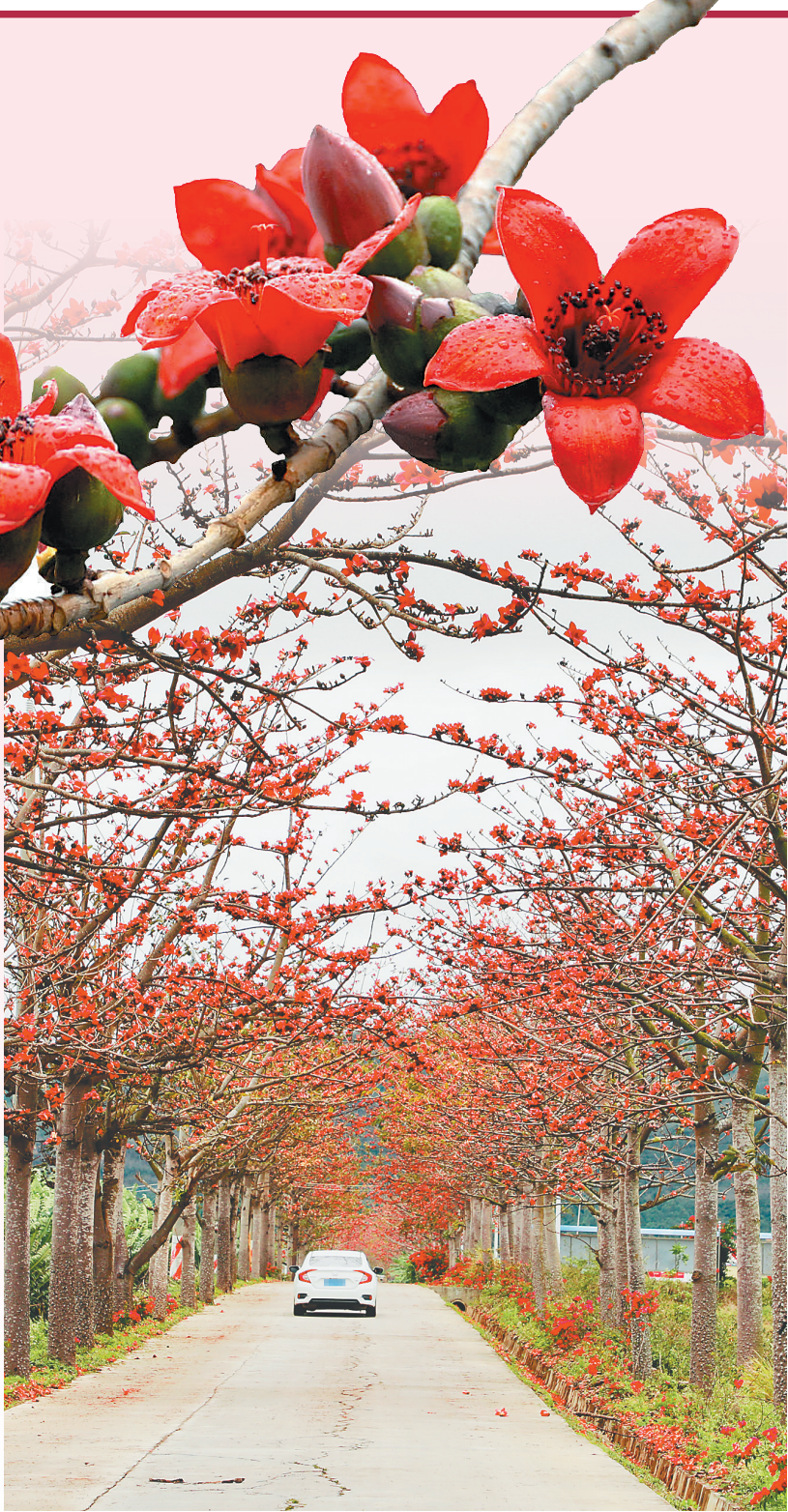
在乌烈镇峨港村，进村的道路两旁种着成排的木棉树。