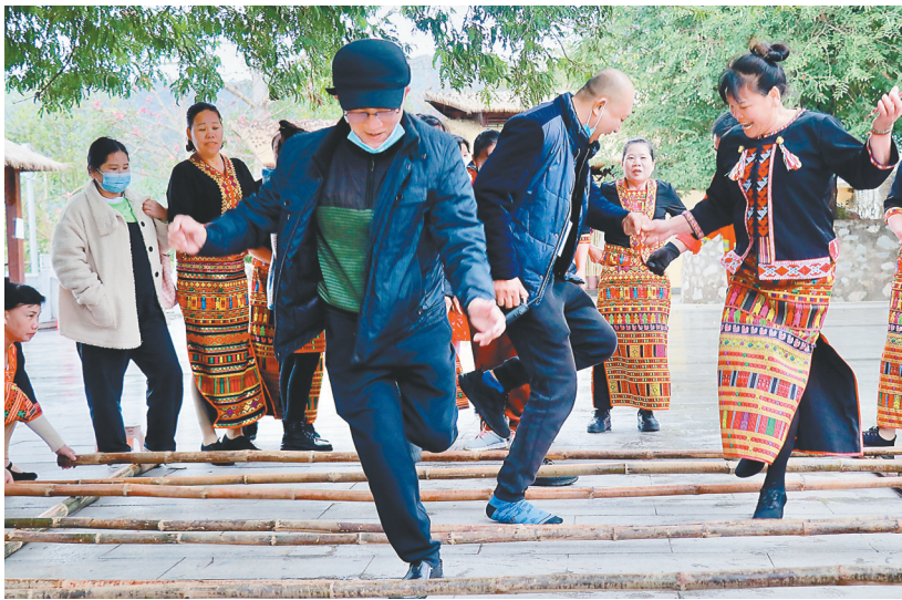
游客在昌江七叉镇尼下村码头体验竹竿舞。