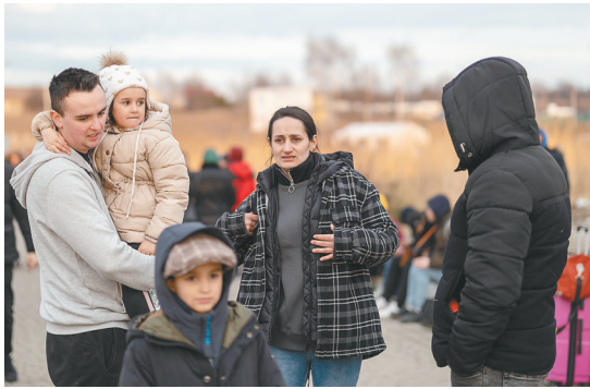
2月26日，乌克兰人抵达波兰边境口岸梅迪卡。