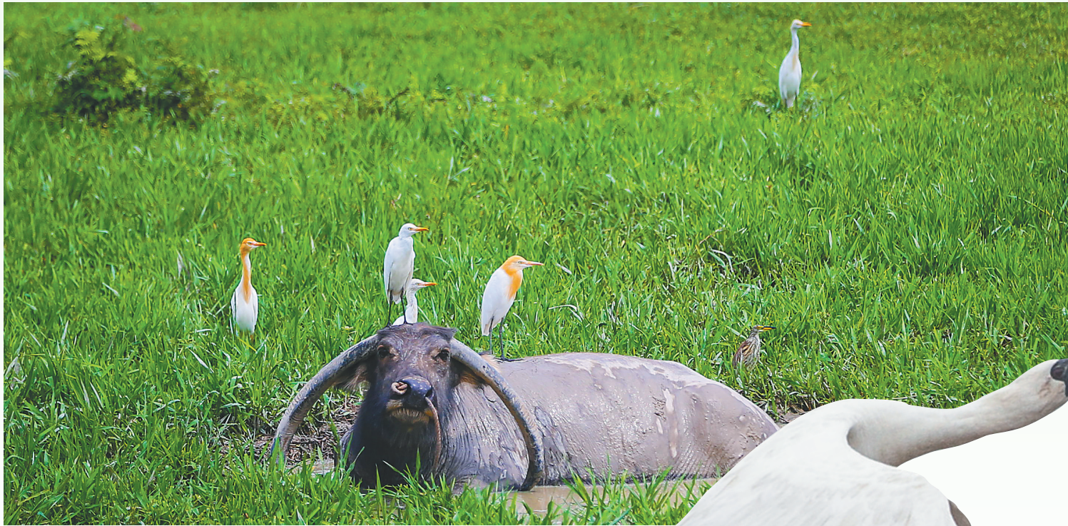
南渡江海口段的一块湿地,两只牛背鹭站在水牛身上。

向春天奋飞,是候鸟与大地的约定。全球每年有数十亿只候鸟,在繁殖地和越冬地之间迁飞。海南岛,是东亚—澳大利亚候鸟迁飞路线上的重要站点,这里草木茂盛、气候温暖,海岸滩涂湿地、红树林等资源丰富,是无数鸟儿向往的远方。每年冬春季,来自五湖四海的候鸟不远万里翩跹而来,在海南“小住”越冬。 今年1月初,海南观鸟会、海口菡萏湿地研究所组织工作人员和志愿者组建11个调查组,赴我省80多个水鸟栖息地开展越冬水鸟调查,让我们对海南越冬水鸟的种类、分布特征有了新的认识。