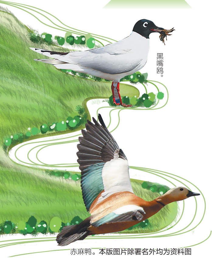
赤麻鸭。本版图片除署名外均为资料图

黑脸琵鹭、黄嘴白鹭、岩鹭、鸕、白腹鸕、游隼、褐耳鹰、黑耳鸕、黑翅鸕、褐翅鸕、小鸕鹚。