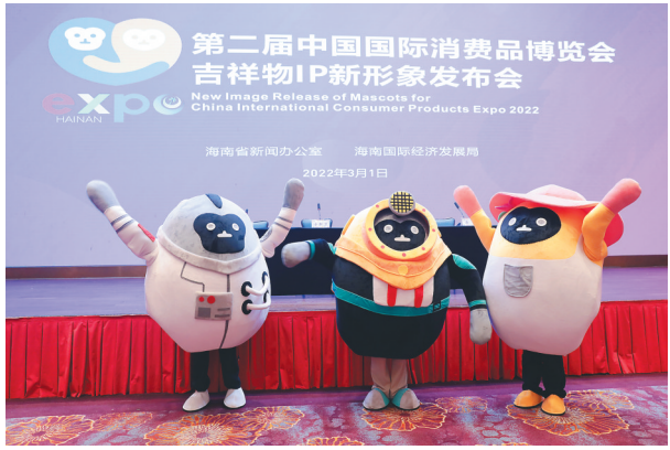
3月1日，消博会吉祥物系列IP新形象——“产业猿”亮相。