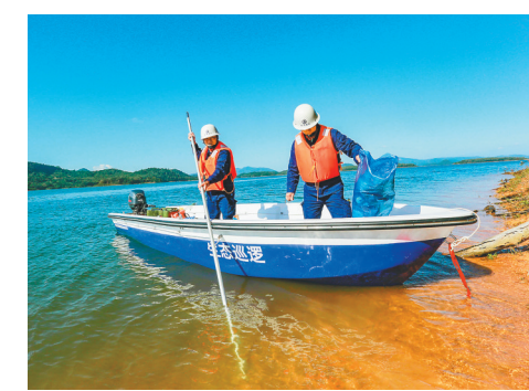
松涛水库生态巡查队员驾乘巡逻快艇进行水生态防护巡逻工作。

2022年全省治水工作要点，明确年度总体任务、考核指标、项目清单、实施主体。各市县、部门（单位）根据实际情况，有侧重地细化明确本地区、行业年度治水工作要点，充分衔接省级年度治水要点，进一步明确项目库、时间表、路线图、责任书及保障措施。