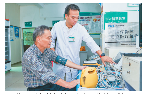
海口秀英美德村卫生室医生使用“健康一体机”帮村民检查身体。

硬件方面，卫生院环境改善，就医环境更舒适了；常规的医疗“大三件”“小三件”都配齐了，老百姓在卫生院就能做彩超、验血等项目；