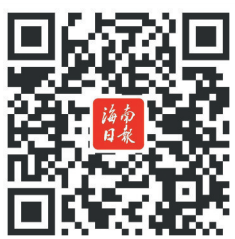
扫码看 创意条漫: 换个视角感受海南新高度

“我是倒着看完了,再正着看,感觉各有不同!”“新鲜有创意!”……该产品在海南日报微信公众号、海南日报客户端、海南日报微博等平台推出后,网友们既点赞产品的新鲜创意,更点赞海南自贸港的发展成就。