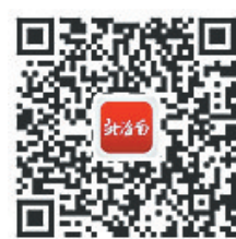
扫码看海南“实践之路”

全局中,海南被寄予厚望。为此,新海南客户端、南海网、南国都市报、“学习强国”海南学习平台联合推出全国两会特别策划《从2013年到2022年,读懂政府工作报告中的“海南实践”》,带你读懂海南探索发展、勠力前行的“实践之路”。