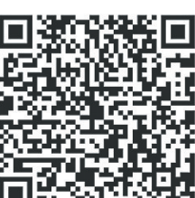
扫码看 “自贸港有约”节目

系列节目通过海南国际传播网、南海网、新海南客户端、“学习强国”海南学习平台、微信、脸书、推特、油管、VK等海内外融媒体传播矩阵向全球发布。据不完全统计,海内外全平台总阅读量已逾377万。