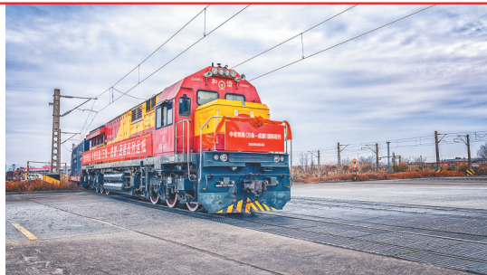
中老铁路(万象-成都)回程班列。