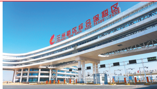
甘肃兰州新区综合保税区。(资料图)