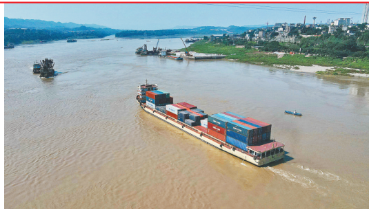
班轮从重庆珞璜港驶离。

“西部陆海新通道涉及多个省份,目前,洋浦已具备多通道资源整合的制度环境和国际中转枢纽港重要节点功能。未来,要不断加强与广西北部湾、广东湛江和重庆等港口的协同联动,在国家战略的推进中,发挥优势,加强合作,互利共赢。”(本报北京3月6日电)