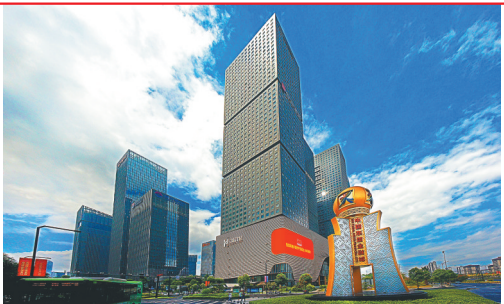
位于广西南宁的中国—东盟金融城外景。周军 摄