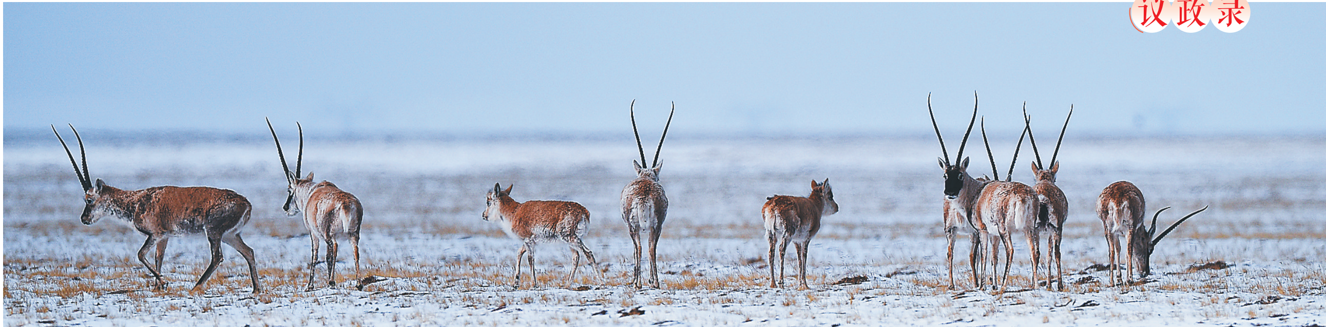
藏羚羊在三江源可可西里地区活动。