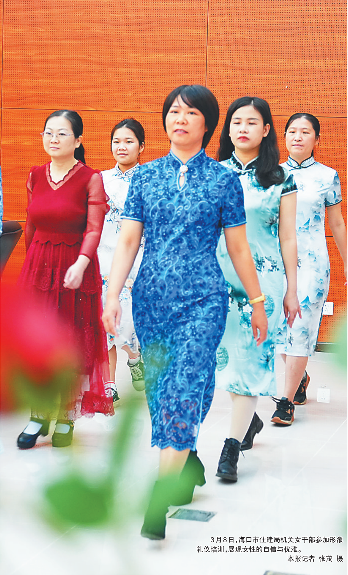
3月8日，海口市住建局机关女干部参加形象礼仪培训，展现女性的自信与优雅。