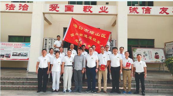
海口市琼山区国兴街道退役军人服务站。

二是打造一流退役军人之家,探索“互联网+退役军人服务”的线上网络工作新模式。一年来,完成涵盖社保接续、就业创业、困难帮扶援助等各领域政策制度体系,让他们文有所施、武有所用,体现“军”的特色,“家”的温暖。三是创建军嫂团队品牌,以丰富军嫂的精神文化生活、提高军嫂的业余生活质量为目标,国兴街道退役军人服务站牵头组建一支有