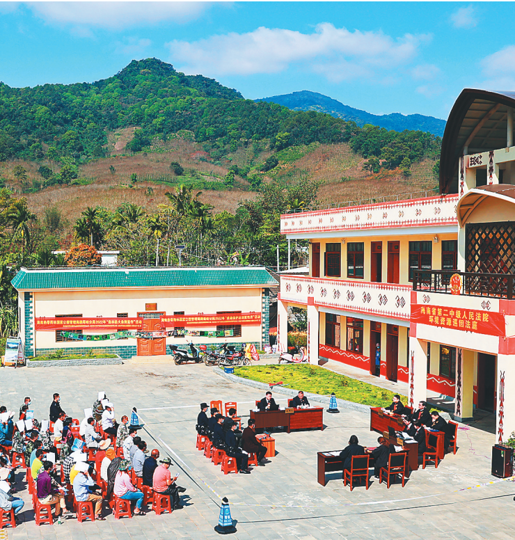
3月9日，省第二中级人民法院环境资源巡回法庭在白沙青松乡青松村，公开开庭审理一起村民非法持枪狩猎案。

“两名被告人之所以犯罪，主要是不懂法，没有改变传统的生产生活习惯。法院把法庭开到村里，给我们上了一堂生动的生态保护法治‘公开课’。”现场旁听的村民纷纷表示，今后一定要严格遵守法律法规，守护好这片热带雨林，共建生态宜居的美丽家园。