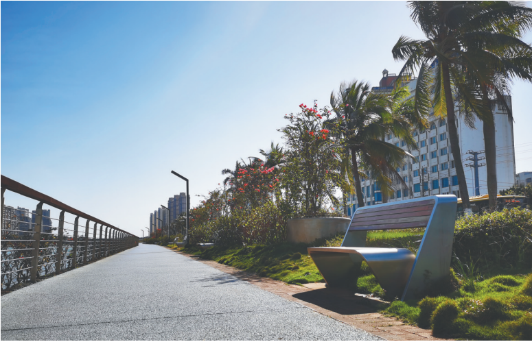
海口海甸溪北岸带状公园内，座椅获市民游客点赞。

量不少，但样式较为单一，坐着并不舒服。比如，海口市人民公园和白沙门公园，每天都要迎来大批市民游客，虽然公园内设置了大量座椅，坐的人却不多。