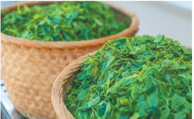
五指山市水满乡的海南大叶种茶茶青。