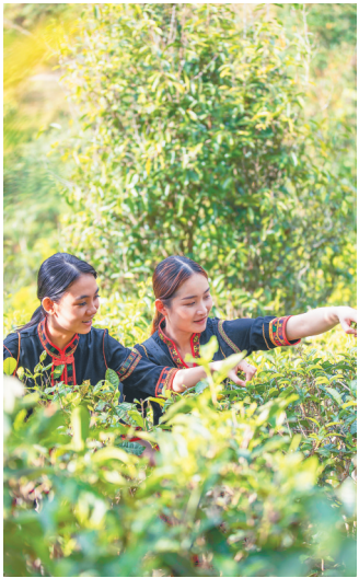
3月11日，五指山市水满乡方龙村村民在采摘春茶。