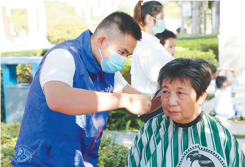
近日，白沙志愿者开展义剪活动。