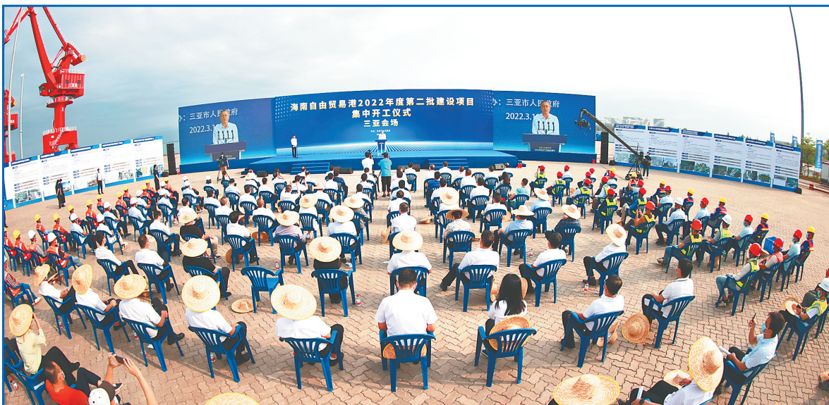
关注海南自由贸易港建设项目 2022年度第二批集中开工

但减少现场施工人员，模板用量可减少90%，建筑垃圾减少近40%。 “你别看模壳的水泥板仅有两厘米厚，由于生产时添加了特殊材料，它的抗压强度很高，达到了C80的强度等级。”曹志永说，使用IRF体系浇筑的剪力墙，可以抵抗裂度达8.5级的地震。 海南绿色建筑产业园是中铁建设集团在海南自贸港布局的首个绿色建筑产业园项目，下转 A02版 ▶