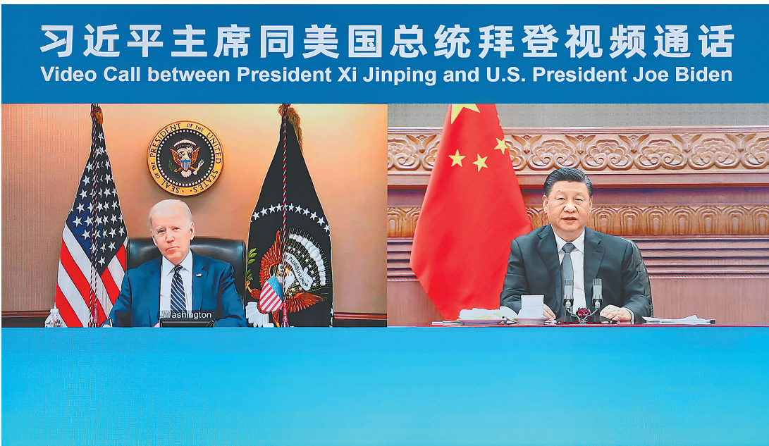
3月18日晚，国家主席习近平在北京应约同美国总统拜登视频通话。

新华社北京3月18日电 国家主席习近平18日晚应约同美国总统拜登视频通话。两国元首就中美关系和乌克兰局势等共同关心的问题坦诚深入交换了意见。 拜登表示，50年前，美中两国作出重要抉择，发表了“上海公报”。50年后的今天，中美关系再次处于