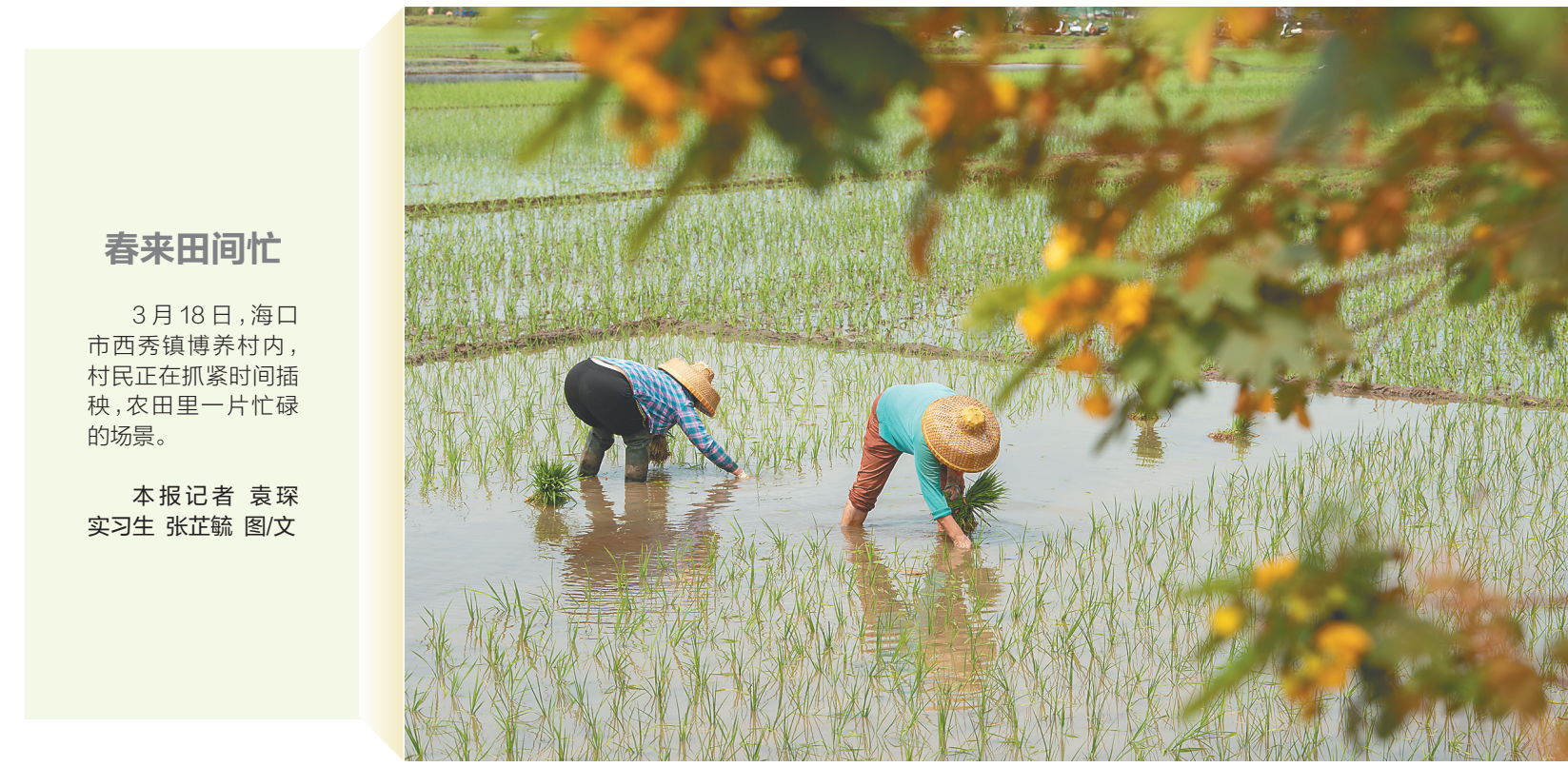
春来田间忙 3月18日，海口市西秀镇博养村內，村民正在抓紧时间插秧，农田里一片忙碌的场景。 本报记者 袁琛 实习生 张芷毓 图/文

本报讯 （记者孙慧 通讯员吉秋平）日前，海南省医疗保障局对外公布，国家组织人工关节集中采购工作将于3月25日在海南实施，我省共有35家医疗机构参与。 目前，我省医保服务平台招采子系统相关模块已完成改造，能够满足人工关节按照系统（组套）进行采购的要求。我省医疗机构和有关企业可登录招采子系统完成配送关系选择、三方协议签订等工作。采购产品范围为人工髋关节、人工膝关节。中选髋关节平均价格从3.5万元下降至7000元左右，中选膝关节从3.2万元下降至5000元左右，平均降价82%。 此外，省医保局将同步调整人工关节医保支付标准，提高医保基金效益，保障参保人员的基本权益。