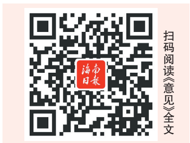
扫码阅读《意见》全文

《意见》明确要强化科技伦理审查和监管,包括严格科技伦理审查、加强科技伦理监管、监测预警科技伦理风险、严肃查处科技伦理违法违规行为。 《意见》还对深入开展科技伦理教育和宣传提出要求,包括重视科技伦理教育、推动科技伦理培训机制化、抓好科技伦理宣传。