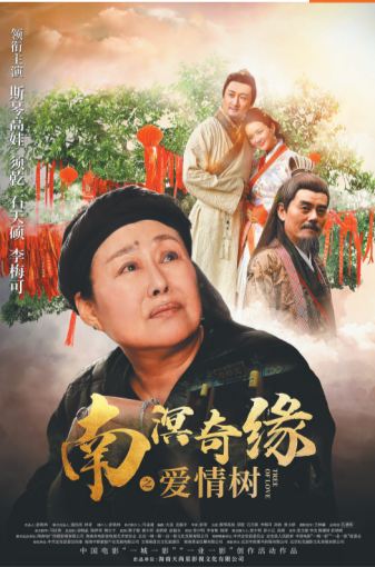
《南溟奇缘之爱情树》海报。 资料图