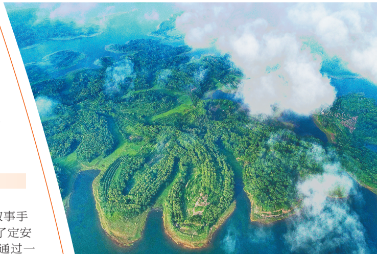
定安南丽湖国家湿地公园。

经济”。 对于旅游产品开发，王健生提出了一份“五好”标准：好故事、好味道、好宝贝、好戏连台和好玩法。“好故事让游客产生更多向往之情，好味道满足游客味蕾的需求，好宝贝让游客‘吃不完兜着走’，好戏连台是结合乡土特色培育新业态、新热点，好玩法则是针对不同群体需求提供特色体验。”王健生表示，唯有不断满足广大游客对美好旅游的消费需求、加强旅游产品体系建设，定安才能将自身资源优势真正转化为发展优势，让影视作品的“火”长久延续下去。■