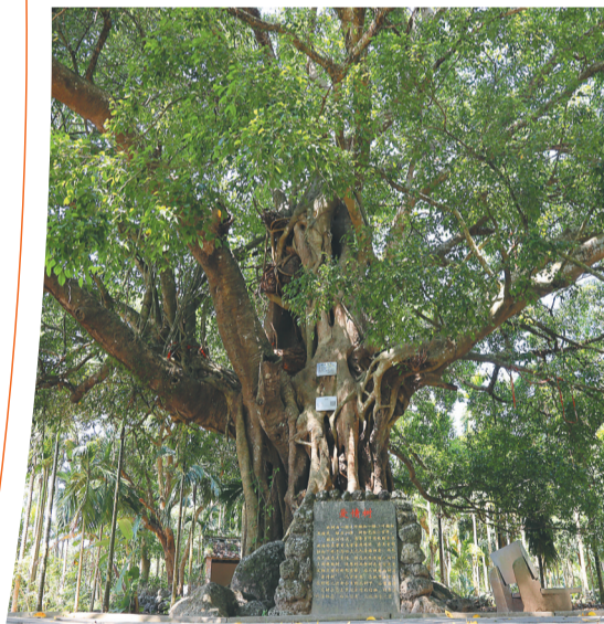
皇坡村里的爱情树。