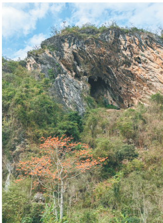
昌江王下乡钱铁洞(钱铁洞旧石器遗址)。

近期,中国科学院古脊椎动物与古人类研究所考古队在海南昌江黎族自治县王下乡进行史前考古学调查时,在旧石器时代遗址钱铁洞顶部发现一处古代岩画遗存。这一发现是海南首次发现古代岩画,具有重要的学术意义,也让海南考古吸引了社会各界的关注。近年来,海南考古事业飞速发展,尤其是冬季相对内地更加温暖的气候,也吸引着许多考古团队选择冬季到海南考古,成为南飞的考古“候鸟”。