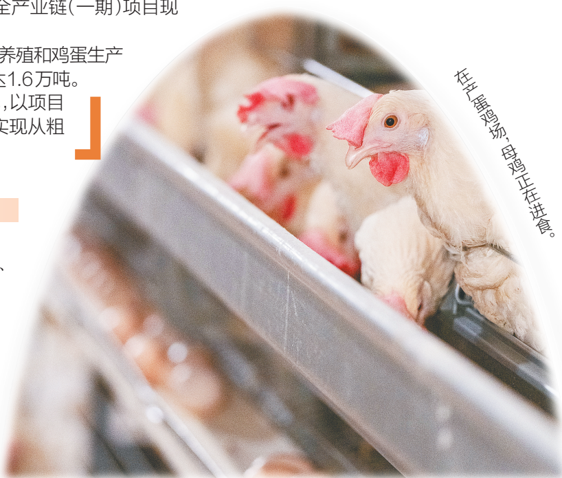
在比脚要轻、母鸡住进舍。