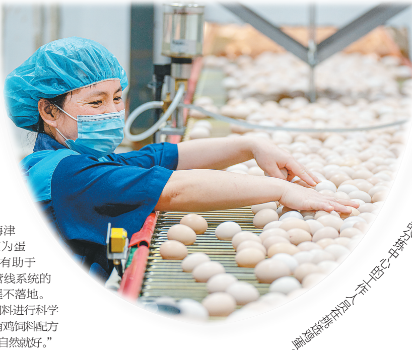
通过设备将鸡蛋分拣并立即。