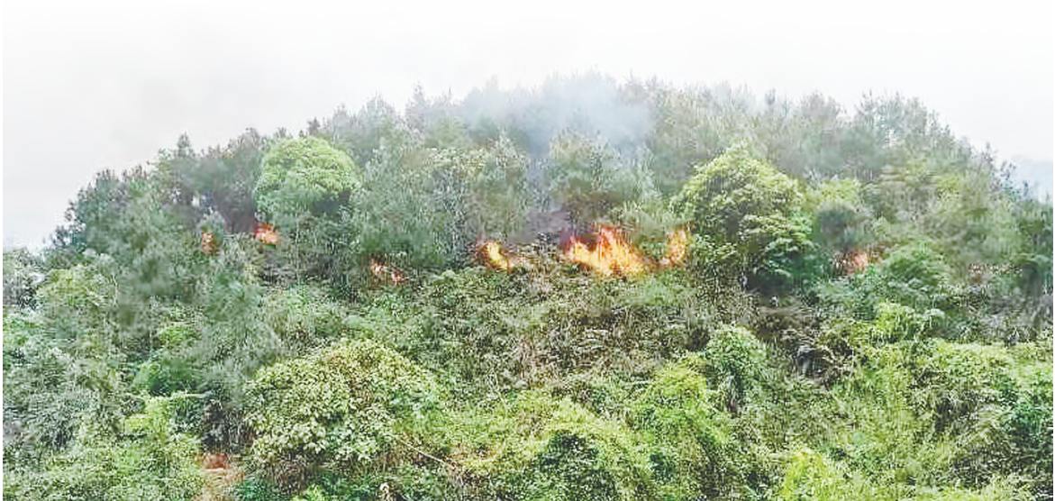
图为3月21日拍摄的藤县坠机事故现场周边画面。