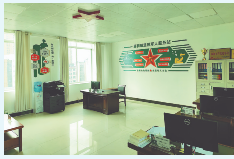
嘉积镇退役军人服务站。

琼海市嘉积镇退役军人服务站于2019年5月挂牌成立,办公地点位于琼海市嘉积镇万泉河畔,全镇辖47个村(居)委会,现有退役军人3592人,其中退役军人党员2167人,残疾军人96人,烈士遗属516人。