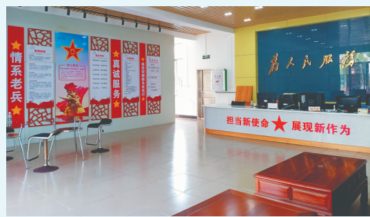
博鳌镇退役军人服务站。

博鳌镇退役军人服务站于2019年5月挂牌成立,围绕“永葆军人本色,勇当海南自贸港建设排头兵”活动,博鳌镇退役军人服务站鼓励辖区内退役军人为建设博鳌田园小镇,助力琼海打造现代化海南东部中心城市和海南经济社会发展“第四极”扛担当作贡献。