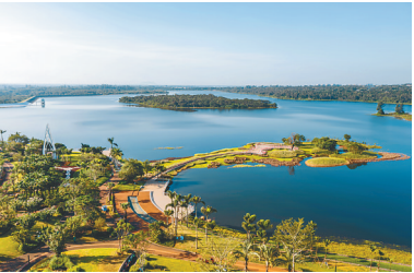
海口·十里春风实景图。

“湖，是大地的眼睛，是诗人的宠儿。”海口·十里春风由海南合甲投资集团倾力打造。该项目位于海口市琼山区云龙镇，规划打造集养生度假、休闲娱乐、教育于一体的湖畔旅居综合体，演绎理想湖居生活。快来海口·十里春风，感受别样的诗意绽放和四季流转的美丽风情。 (广文)