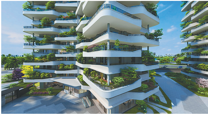
佳元·江畔锦御效果图。

间，有效确保花木种植的高度及采光环境。前庭后院的广阔空间里，庭院外延面最大宽幅约4.7米，最大长度约46.7米，让您畅享270度江景观赏视野。