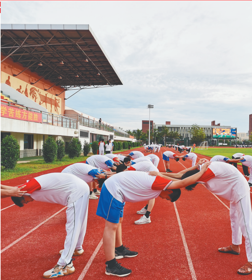
北师大海口附属学校初三学生备战中考体育考试。