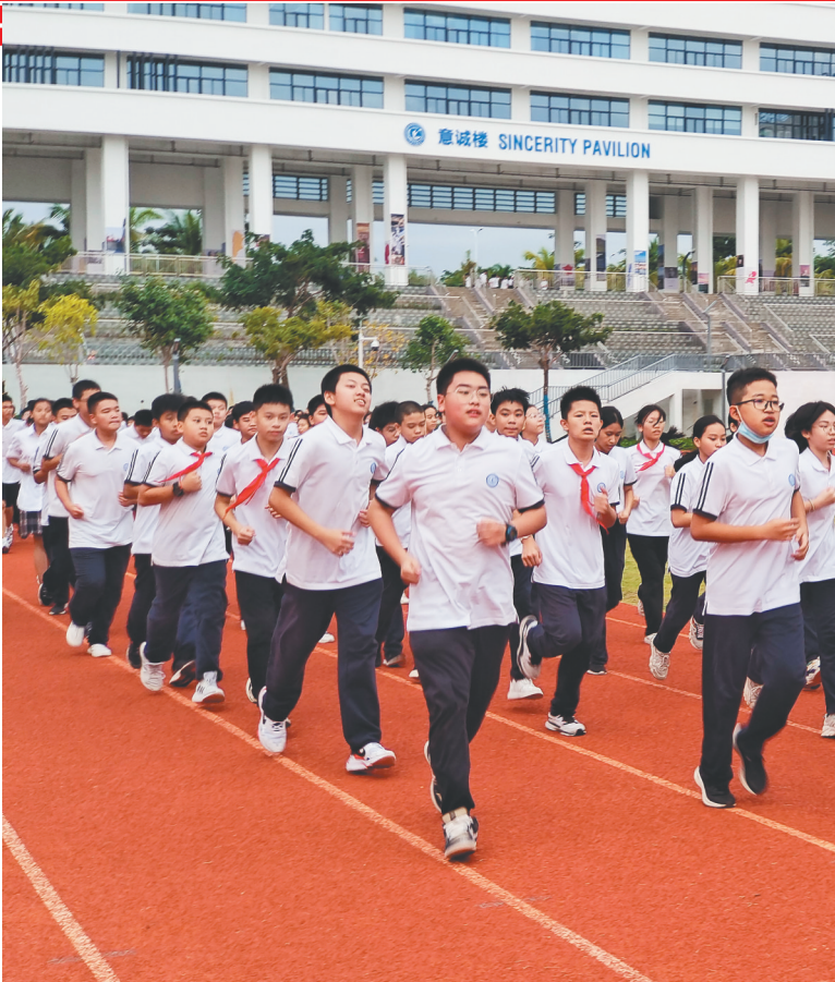
上海外国语大学三亚附中中学生参加跑步训练。

日前,为期近40天的2022年海南省中考体育科目考试举行。 今年全省中考体育科目考试与往年相比有较大差异,考试方式由过去的2个必考项目调整为“1个必考项目+1个选考项目”。如何做好“1+1”这道选择题?近日,海南日报教育融媒工作室就此采访了海南省教育研究培训院体育教研员杜震和海口市教育研究培训院体育教研员王芬。