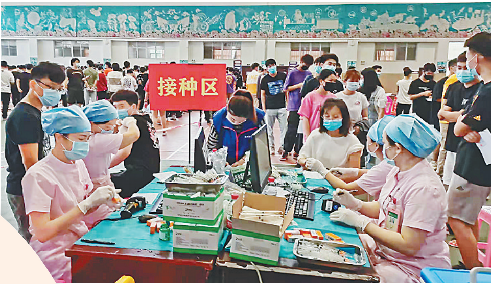
海口妇幼保健院儿童保健科护士为学生接种疫苗。