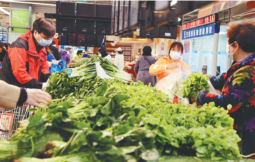
三月三十一日，在上海市普陀区的一家超市内，市民在购买蔬菜。