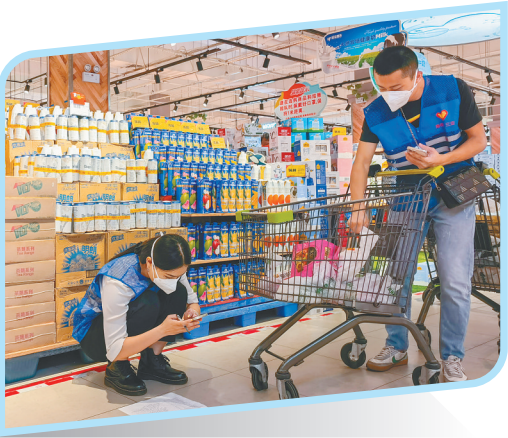
5日，志愿者在三亚一超市帮封控区域内居民购买生活物资。

4月6日、7日，琼海市将在博鳌镇及潭门镇部分片区继续进行全员第二轮、第三轮核酸检测工作。