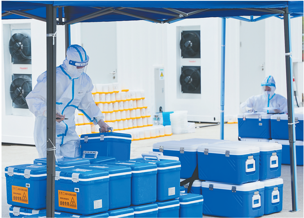
移动方舱 高效运转

该负责人介绍，万宁市针对神州半岛居民医疗需求建立了一套就医用药流程，为减少接触，医疗组对普通病人以电话问诊服务为主，对危重症病人提供上门服务，严格按防控要求转移病人。对用药需求，由各小区物业公司为单位，填报药品需求清单，每日配送两次药品，满足居民需求。（本报万城4月5日电）