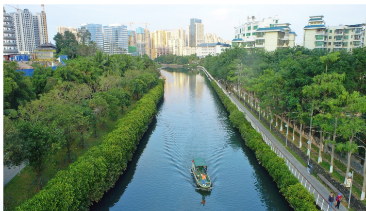
►海口市美舍河国兴桥段，环卫工人正在进行河道清洁。