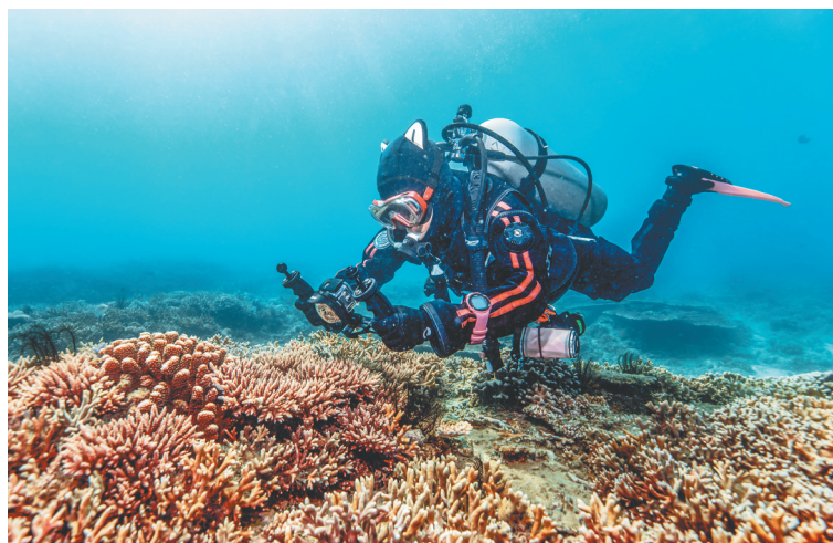
►近日，在三亚蜈支洲岛附近海域，工作人员记录珊瑚礁修复生长情况。