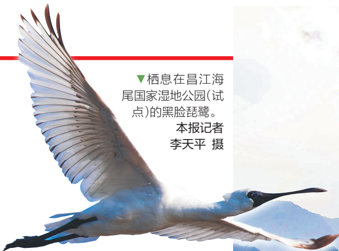
▼栖息在昌江海尾国家湿地公园(试点)的黑脸琵鹭。