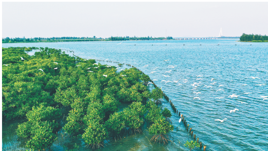
▲在海口东寨港红树林国家级自然保护区，鸟儿自由飞翔，一幅人与自然和谐共处的图景跃然眼前。