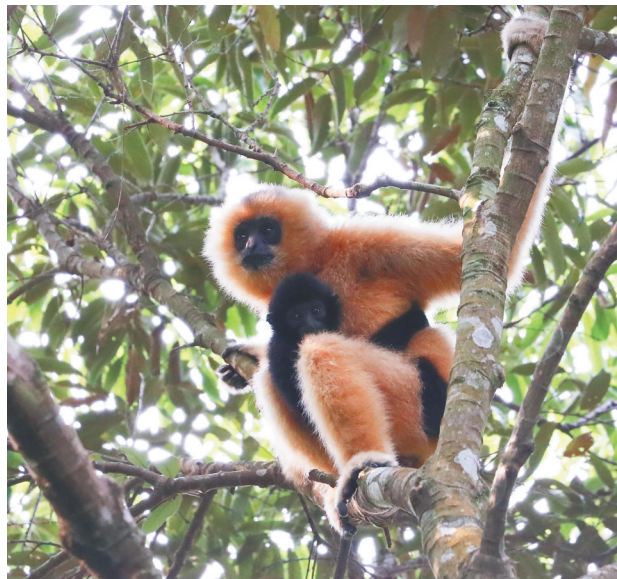
►栖息在白沙青松乡的海南长臂猿及幼猿。