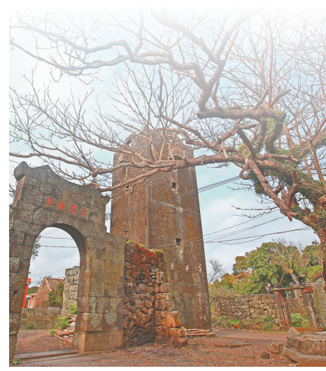
美丽农村路既是生态路也是景观路，图为海口石山镇古村落村貌。