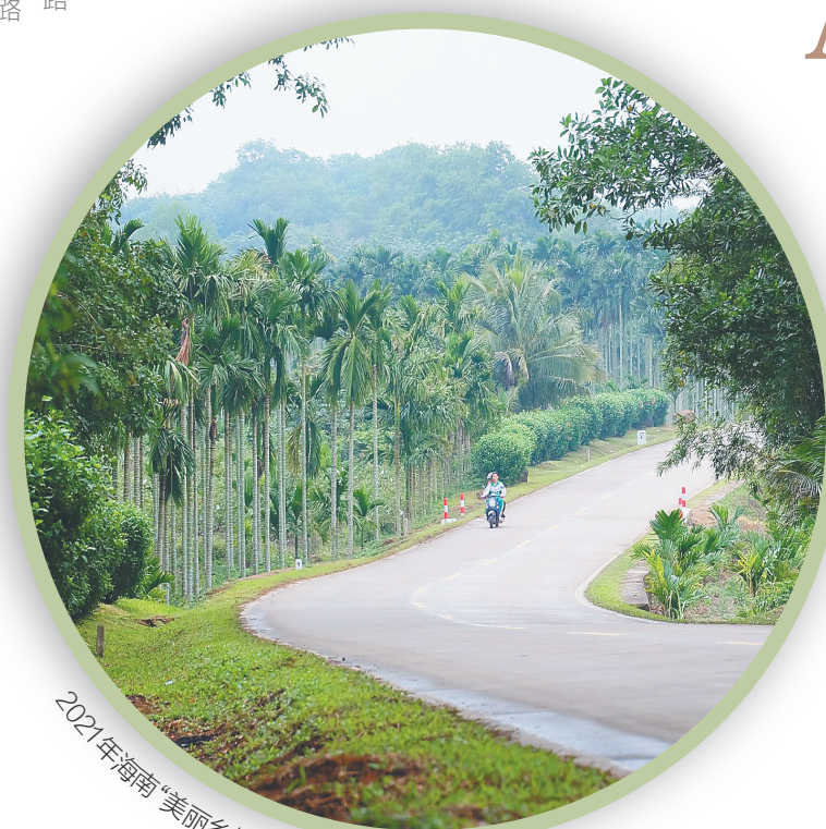
2021年海南“美丽乡村路”示范路海口浮美线县道公路。

◎“十三五”期间 我省投入约360亿元，大规模开展贫困地区骨干通道建设，完成了五指山市、保亭、白沙等市县通高速公路任务；投入约206亿元在全省范围内开展自然村通硬化路工程、窄路面拓宽工程、县道改造工程、生命安全防护工程、农村公路桥梁建设和危桥改造工程、旅游资源路工程等“农村公路六大工程”建设，在全国范围内率先实现具备条件的自然村100%通硬化路，100%解决农村公路安全防护问题；提前一年完成“两通”任务。 ◎“十四五”期间 我省公路网络将实现更高质量的互联互通。“丰”字型+环线综合运输通道布局加快构建，公路网总里程达到42000公里，高速公路里程1500公里，普通国省干线公路二级及以上公路比例达到80%以上，力争县级行政中心基本实现10分钟上高速，具备条件的重点乡镇基本实现15分钟上高速。 (侯赛 辑)