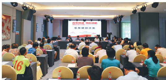
为“七个一”作品征集活动在乐东举办的研创沙龙。