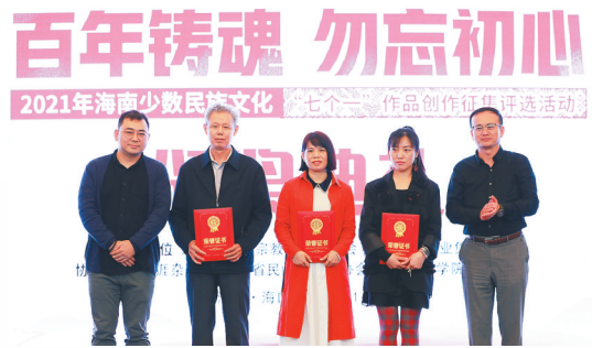
“七个一”作品征集活动颁奖典礼现场。