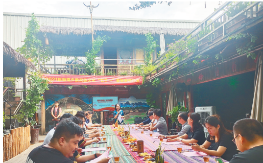
为“七个一”作品征集活动举办的音乐研创沙龙。

在海南少数民族文化“七个一”工程系列丛书的后记中，编委会写道：“这道洋洋洒洒数以万计汉字构筑的风景，是我们捧给海南少数民族文化的初心，是我们对海南少数民族文化的热爱、诠释、担当和出发。”