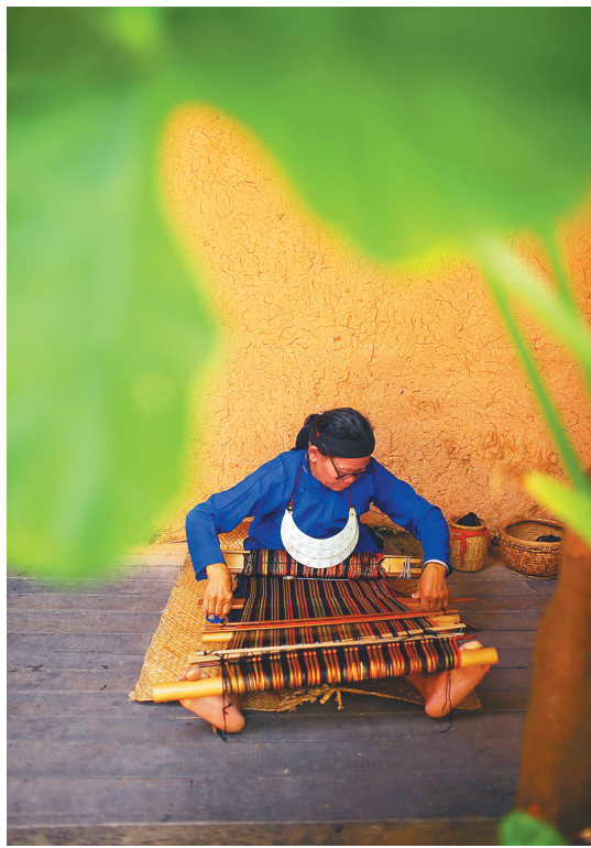
“七个一”摄影获奖作品《叶下织锦》。