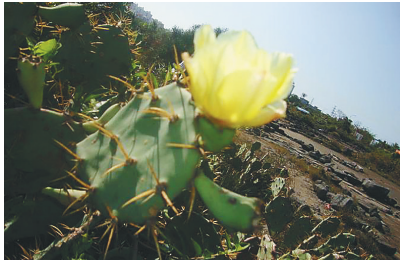
岛西沿海海岸上的仙人掌。资料图

人掌,有的簇簇成团;有的三五簇相接,重重叠叠地堆成小沙丘似的;还有的一排排、密密麻麻地排列在田园小路边。仙人掌的掌面上长满坚硬的刺,犬牙交错,像一张密网似的。岛西沿海的农民懂得因地制宜、就地取材,多用仙人掌作为篱笆来围拢田园,既省钱,又能抵挡动物闯入田园里糟蹋农作物。如果你站在海岸高处,极目远望海滩上的田园,映入眼帘的是一片黄橙绿错综的景色。黄橙的是田野里熟透的哈密瓜、柑橘、菠萝,绿的是一道道纵横有序的仙人掌藩篱。每当目睹岛西海滩田园这种美妙的景色时,我不得不敬佩岛西农民劳动致富的精神意志与创造力。 岛西世代代的农民对仙人掌有一份由来已久的情结。小时候,我曾听家乡一些前辈说,在缺医少药的旧社会,当村里有人长了毒疮或患了癰疽等疾病时,常用仙人掌配些草药当药物治疗。其做法是去掉仙人掌掌面上的硬刺,再剥掉掌面表皮,然后捣烂,掺和配方草药,敷贴在患处,药效很好。在抗日战争年代,琼崖纵队在山区打游击时,遇到蚊虫叮咬,长毒疮、结脓包时,也常用仙人掌包贴敷用,数日即可清热解毒,化掉脓肿。可见仙人掌这种植物,它对人类无所需求,但它给予人类的还真不少。 岛西海岸的仙人掌,没有挺直的身材,又长得横斜逸出,形状怪异,但株株仙人掌总是积极向上,绝无倒垂之状。从外表上看,仙人掌确实缺少惹人眼球的外貌,光是它满身的硬刺,就让不少人望而生畏。所以,人们无法用“美丽”“雄壮”之类的形容词来赞美它,但它从不在乎生存环境的好坏,也不分时令,更不需要人们浇水、施肥或管理,只要落地,它都能随处生根,而且一味疯长。无论岛西沿海常年的酷热干旱,还是台风天气的风雨交加,仙人掌都能坦然面对,倔强地生长。仙人掌这种在艰苦环境中勇于抗争的倔强精神和顽强意志,足可以使很多植物在它面前相形失色。由于仙人掌其貌不扬,往往很容易使人忽略对它内在精神与品格的探讨。但在北美洲的墨西哥,仙人掌却身位高贵,被誉为墨西哥的国花。可见,世人对仙人掌的审美观,也是“仁者见仁,智者见智”。 岛西海岸的村民热爱仙人掌,从不