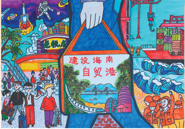
《建设海南自贸港》 定安县第一小学学生 刘云臻 作 指导教师：吴丽珠