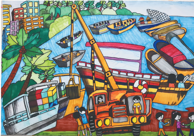
《共建自贸港》 万宁市大茂镇中心学校学生 谢小欣 作 指导教师：吴钟柳