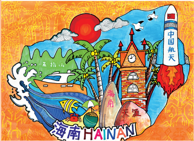
《海南印象》 海口市第二十七小学学生 吴羽霏 作 指导教师：邢卫