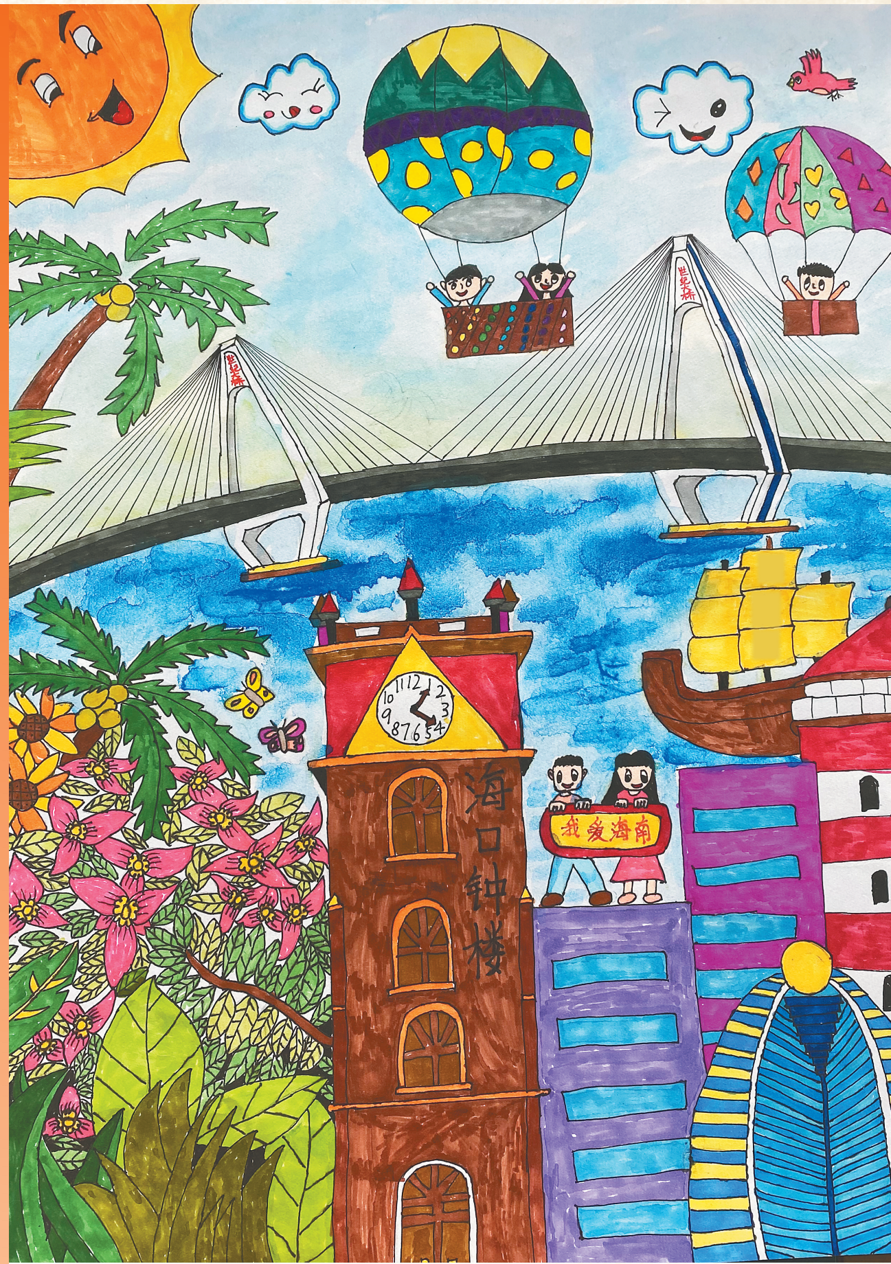
《我爱海南》 海口市长滨小学学生 邝婕莹 作