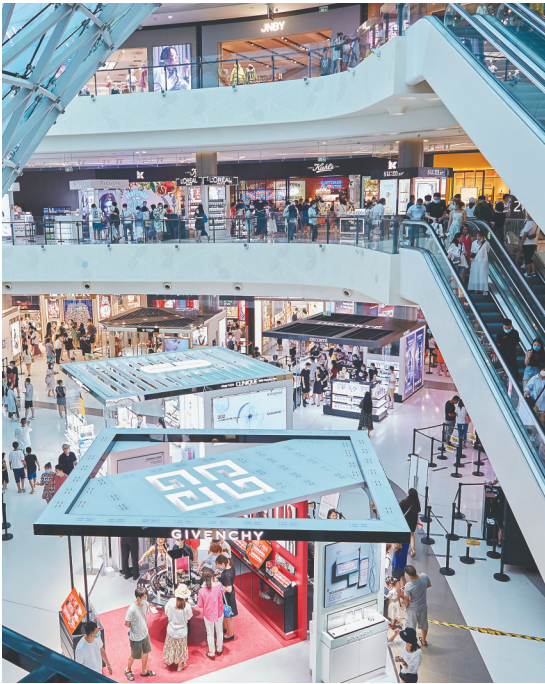
市民游客在三亚国际免税城购物。(资料图片)