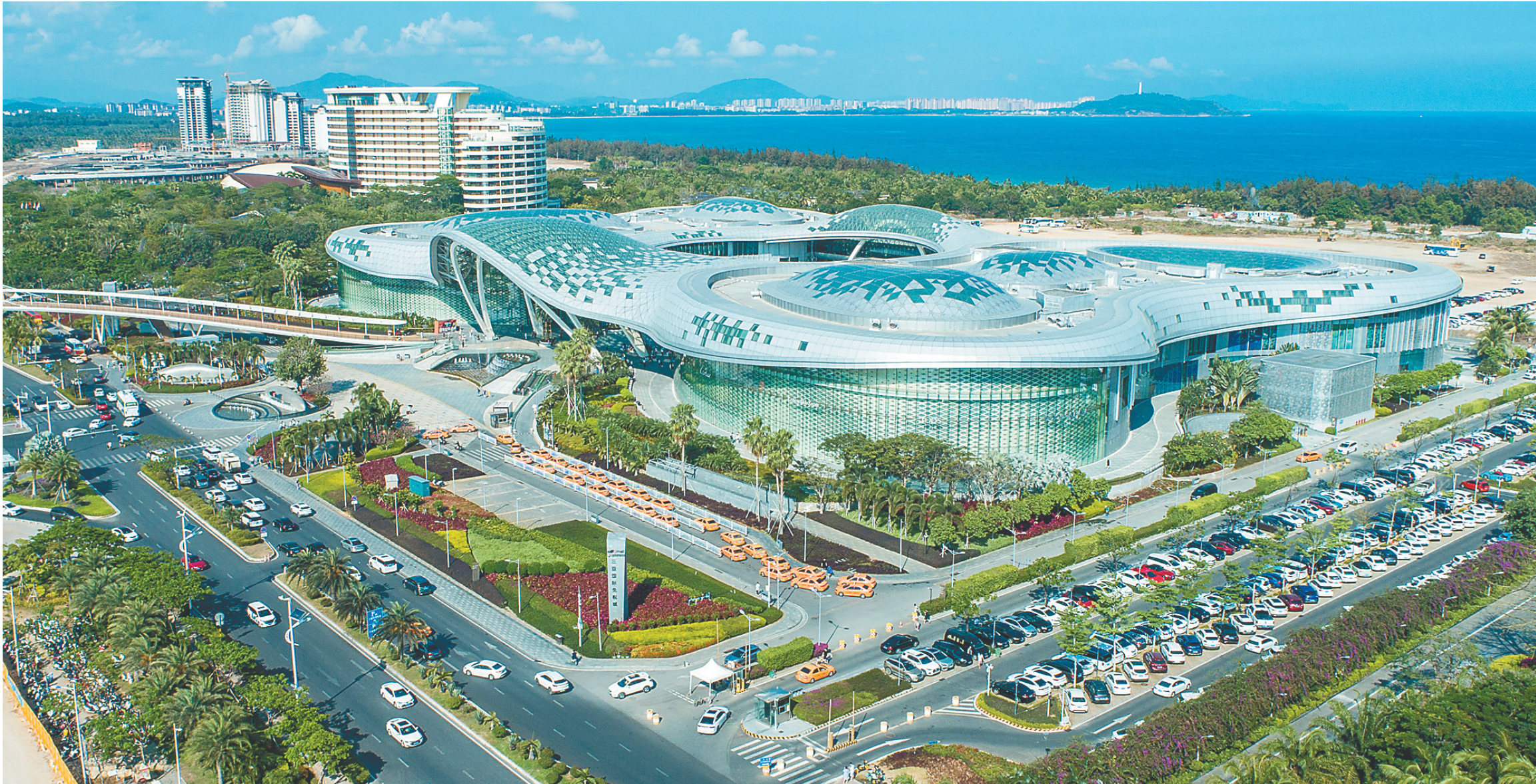
航拍三亚国际免税城。

4月11日上午,习近平总书记来到三亚国际免税城,实地了解离岛免税政策落地实施等情况。习近平总书记指出,要更好发挥消费对经济发展的基础性作用,依托国内超大规模市场优势,营造良好市场环境和法治环境,以诚信经营、优质服务吸引消费者,为建设中国特色自由贸易港作出更大贡献。