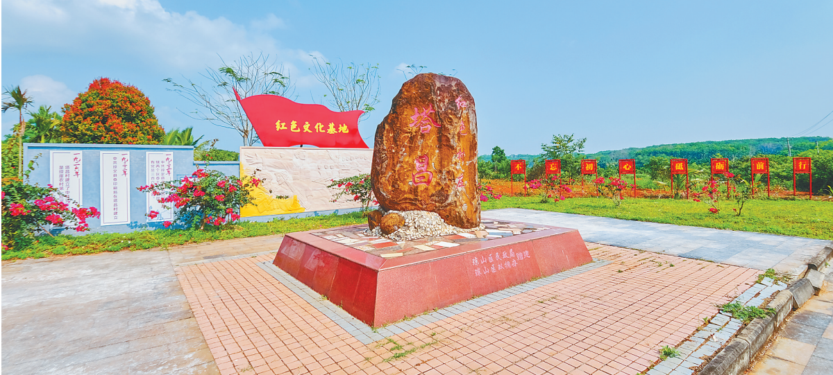
海口市琼山区塔昌村一景。