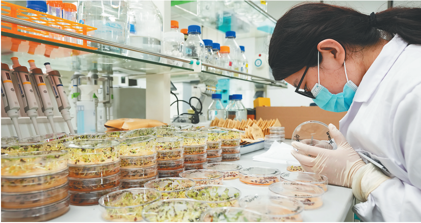
近日，在位于三亚的崖州湾种子实验室，科研人员正在观察种子样本。

“真实世界研究转化处的一个重要职责，就是让中国人民尽快用上国际先进药械。”王晋说，真实世界研究作为一项全球领先的医学研究方法，通过乐城实践为中国药品、器械评审审批改革探索新方法、新标准、新路径，加速国际创新药械在中国境内的上市注册，让中国