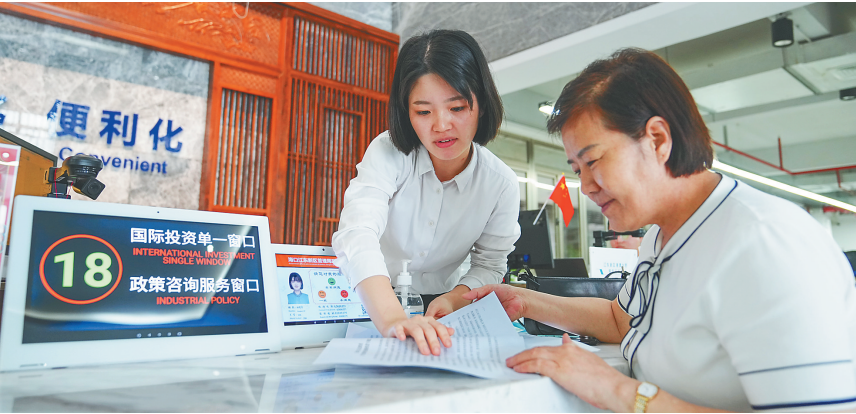
近日，在海口江东新区政务服务中心，工作人员为企业提供政策解答服务。