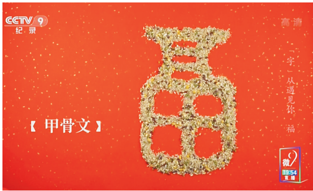
《“字”从遇见你》视频截图。

近期,央视纪录片《“字”从遇见你》开播,为观众讲述汉字背后的故事。该片从最基本的汉字切入,每集聚焦一字,以故事化的形式讲述每个字的来源和流变。神奇的汉字世界背后蕴藏着丰富的文化密码,让我们一起去了解汉字的起源与演变过程吧。