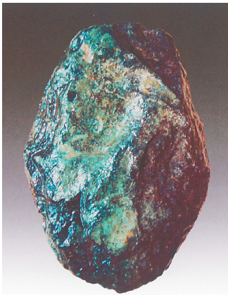
南阳黄山遗址出土的独山玉材质玉铲。

近期，2021年度全国十大考古新发现在京揭晓，河南南阳黄山遗址成功入选。黄山遗址被认为是中国最早的玉石手工业“生产基地”，它的发现填补了中原和长江中游新石器时代玉石器手工业体系认知的空白。独山玉作为黄山遗址的主要手工资源，成为人们关注的焦点。