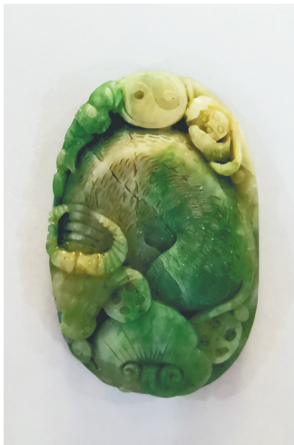
现代独山玉绿白料挂坠。