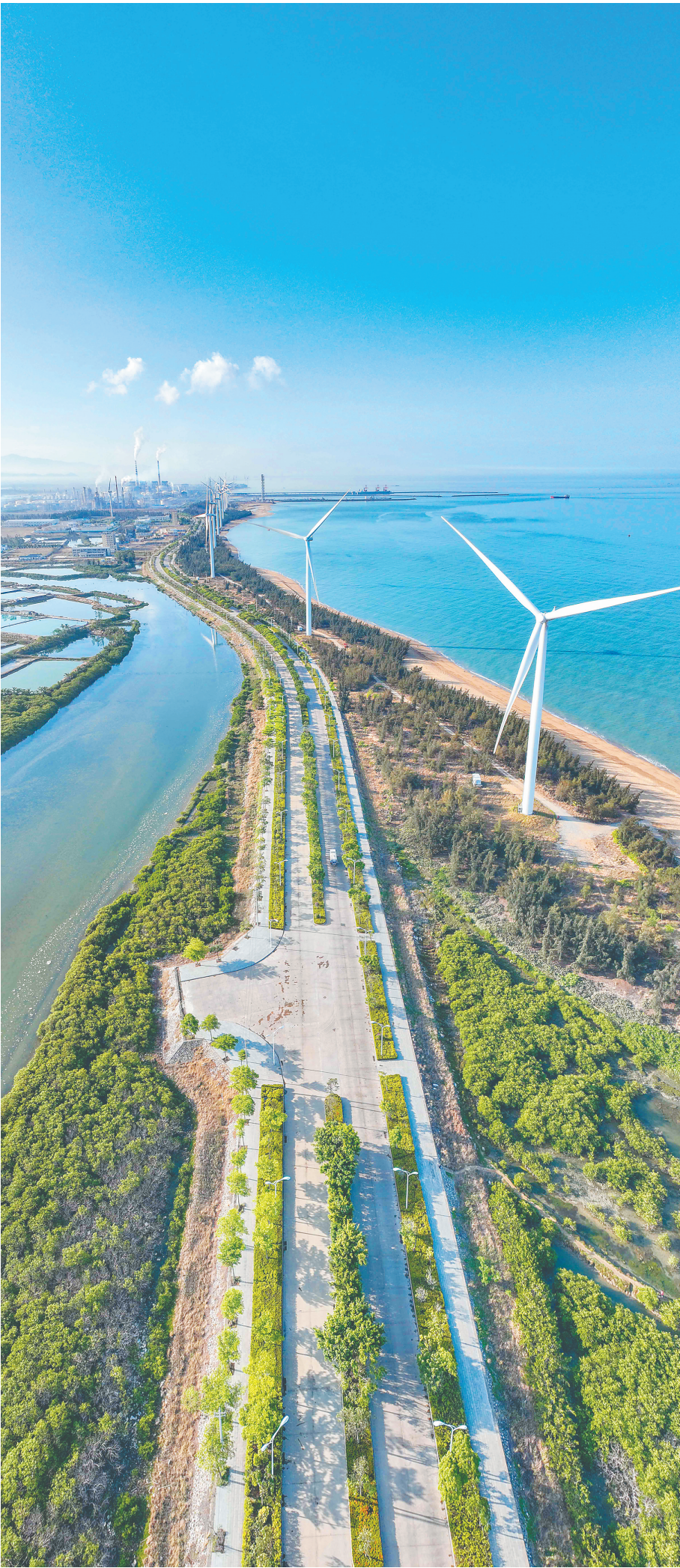
在东方市西海岸,滨海风光秀丽宜人。

建设等。 在现代服务业方面,东方建立完善“空水公铁”高效衔接、海陆空快速转运的多式联运体系,构建“通道+枢纽+网络”国际商贸物流体系,培育壮大现代服务业。在高新技术产业方面,东方围绕“高附加值+低环境负荷”,高效配置能耗指标,优化存量、用好增量、放大变量,推动石化上下游产业链紧密结合、产业耦合、低碳协同循环发展,同时大力发展清洁能源、生态环保等相关产业。 在热带特色高效农业方面,东方以国家农业绿色发展先行区建设为抓手,深入推进农业规模化、标准化、绿色化和品牌化发展,构建“5+N”现代农业产业集群,抓好冬季瓜菜基地、常年蔬菜基地建设等;大力发展特色水产种苗、深海网箱养殖,建设国家级海洋牧场示范区,争创国家级渔业健康养殖示范区。 (本报八所4月19日电)