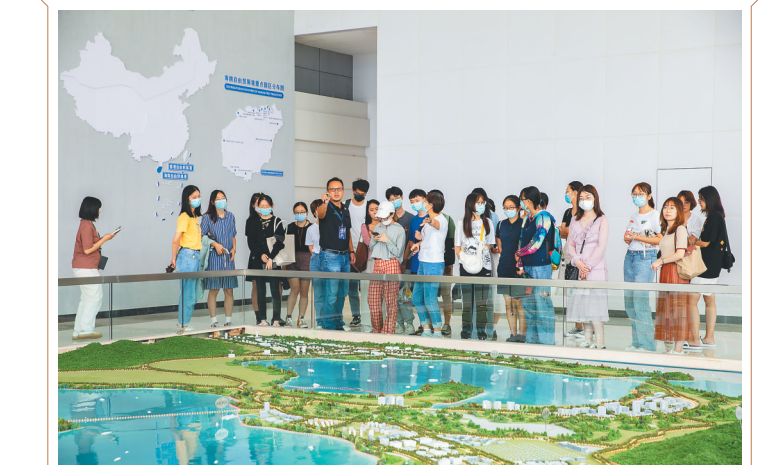
2021年9月23日，陵水黎安国际教育创新试验区首批学生参观试验区规划展厅。(资料图片)