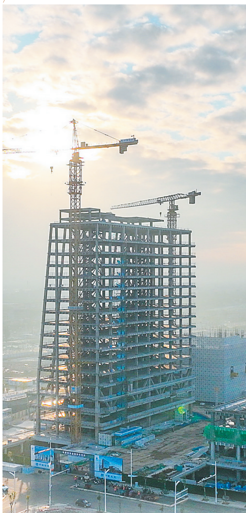
建设中的海口江东新区总部经济区(生态CBD)。