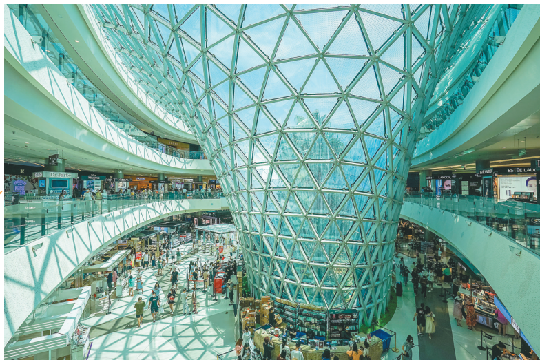
三亚国际免税城的热闹场景。(资料图片)

特别是2021年，海南主要经济指标增速历史性走在全国前列。2021年，全省地区生产总值增长11.2%，增速位居全国第二；两年平均增长7.3%，位居全国第一。2021年地方一般公共预算收入增长12.9%，全省固定资产投资同比增长10.2%，社会消费品零售总额增速全国第一，两年平均增速全国第一。