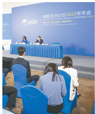
4月20日,博鳌亚洲论坛2022年年会首场新闻发布会现场。

4月20日,中国能建参展人员介绍如何通过数能融合实现精准、高效利用能源。