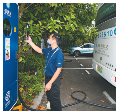
工作人员在博鳌亚洲论坛国际会议中心附近为客车充电。