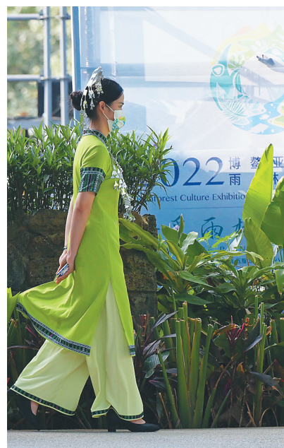
身穿绿色黎族文化元素服饰的服务人员是一道靓丽的风景。