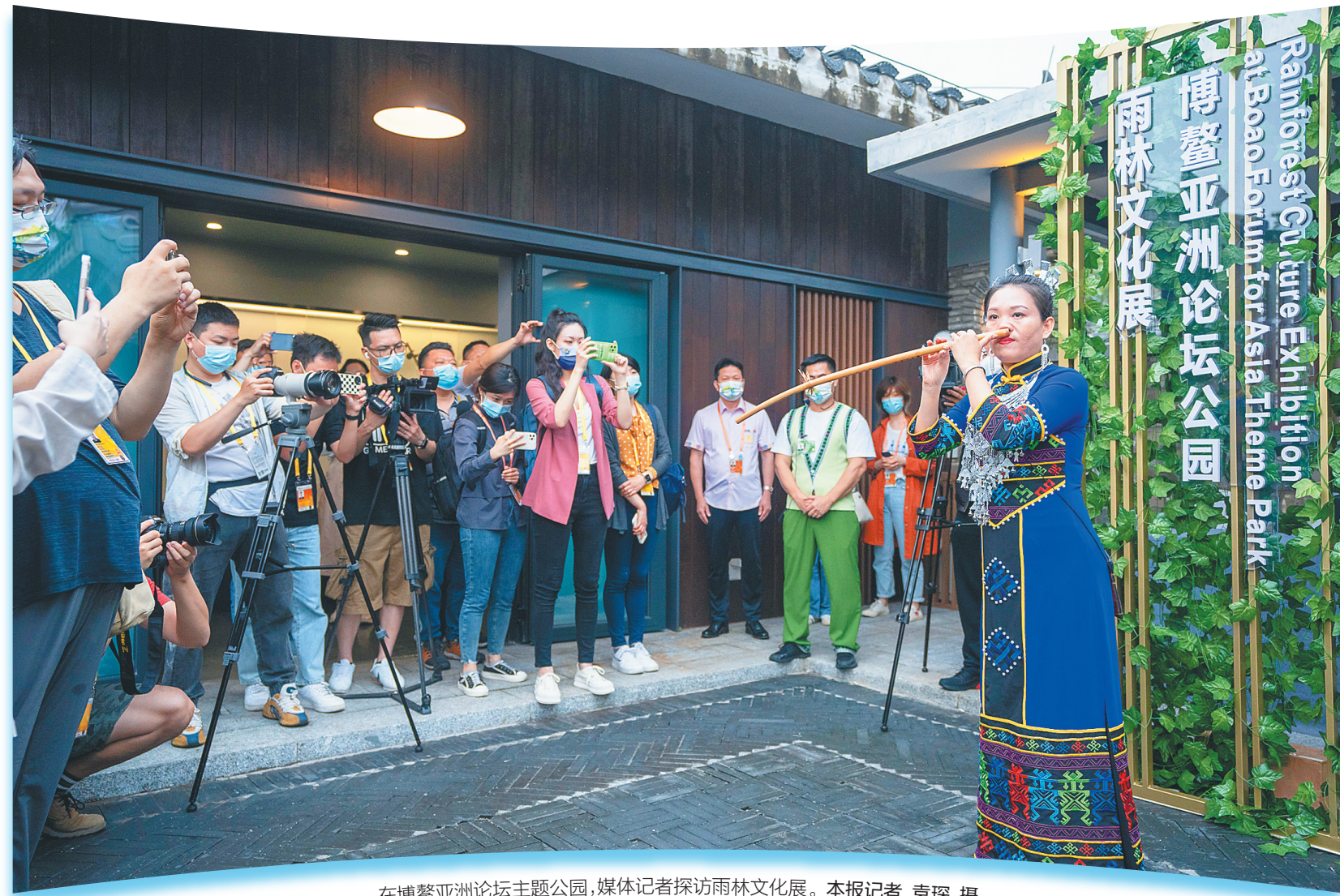
在博鳌亚洲论坛主题公园,媒体记者探访雨林文化展。

本报博鳌4月20日电(记者孙慧)穿过万物共生雨林长廊,喝一杯五指山红茶,欣赏热情的黎族苗族歌舞,这一刻仿佛置身生机勃勃的热带雨林。4月20日至4月22日,由五指山市主办的“寻觅雨林·万物共生”雨林文化展在博鳌亚洲论坛主题公园展出,将海南热带雨林景观“搬进”博鳌,让更多人沉浸式体验雨林文化,感受“两山理论”在海南的生动实践。