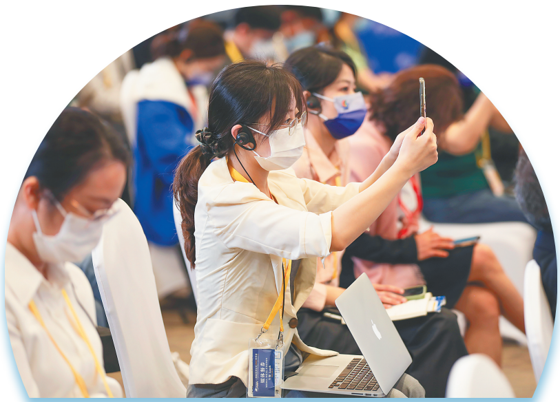
在“缩小免疫鸿沟”共享健康福祉论坛上,媒体记者拍摄现场。

题的分论坛,这意味着主办方不仅贯彻了“绿色办会”理念,还为亚洲各国寻求共识,用更积极和更稳妥的方式应对全球气候变化问题,推动实现碳达峰碳中和、绿色发展、绿色转型搭建了平台。