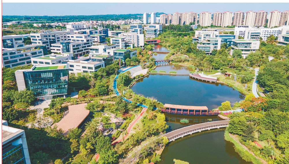
海南生态软件园。