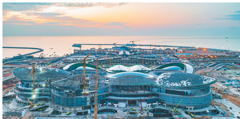
建设中的海口国际免税城项目商业中心。