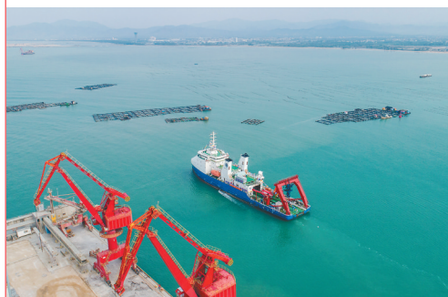
中科院“探索一号”船载着“深海勇士”号载人潜水器从三亚崖州湾科技城南山港码头启航,执行科考任务。