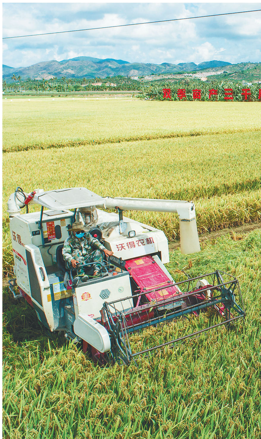
三亚市崖州区(坝头)南繁公共试验基地,联合收割机在作业。