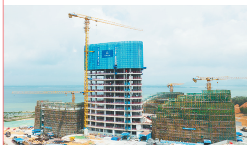
建设中的陵水黎安国际教育创新试验区图书馆(暨国际学习中心)项目。