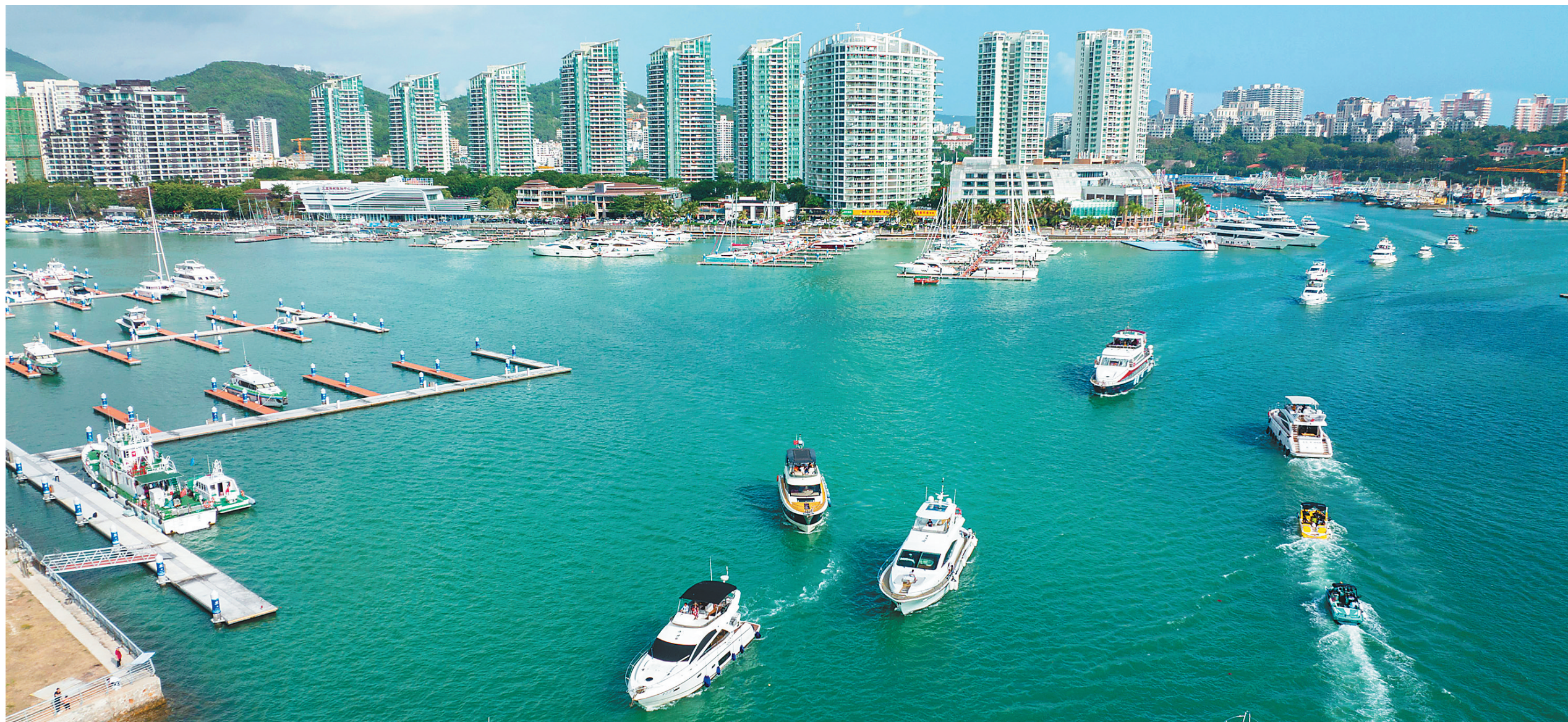
三亚港,游客搭乘游艇出海。