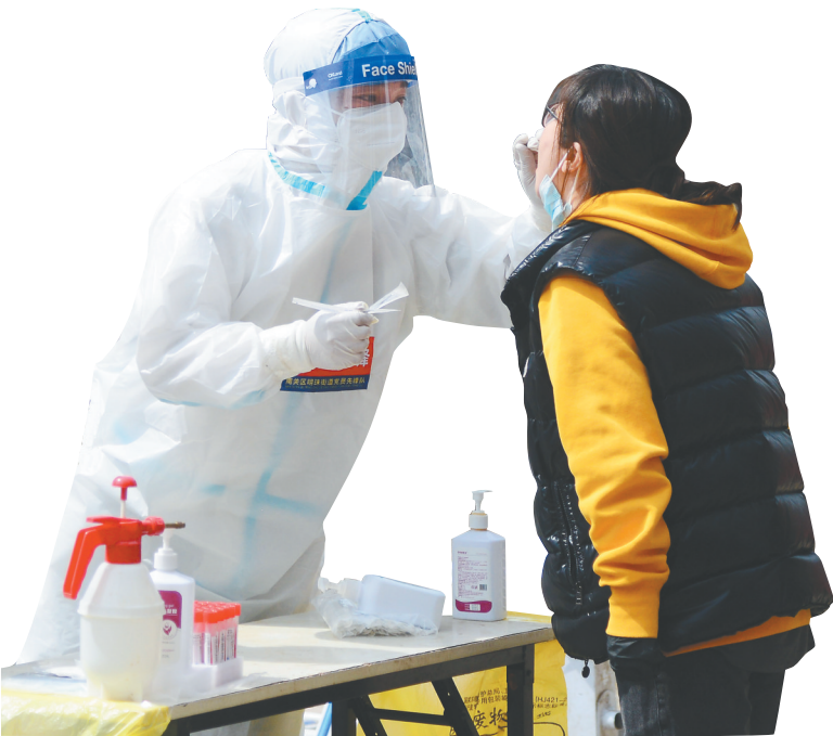
4月20日，在长春市一处核酸检测点，居民接受核酸检测采样。新华社发

做好疫苗接种、坚持落实个人防护措施仍是应对疫情的“利器”。中国疾控中心免疫规划首席专家王华庆建议符合条件的老年人尽快接种新冠疫苗，及时完成加强免疫。