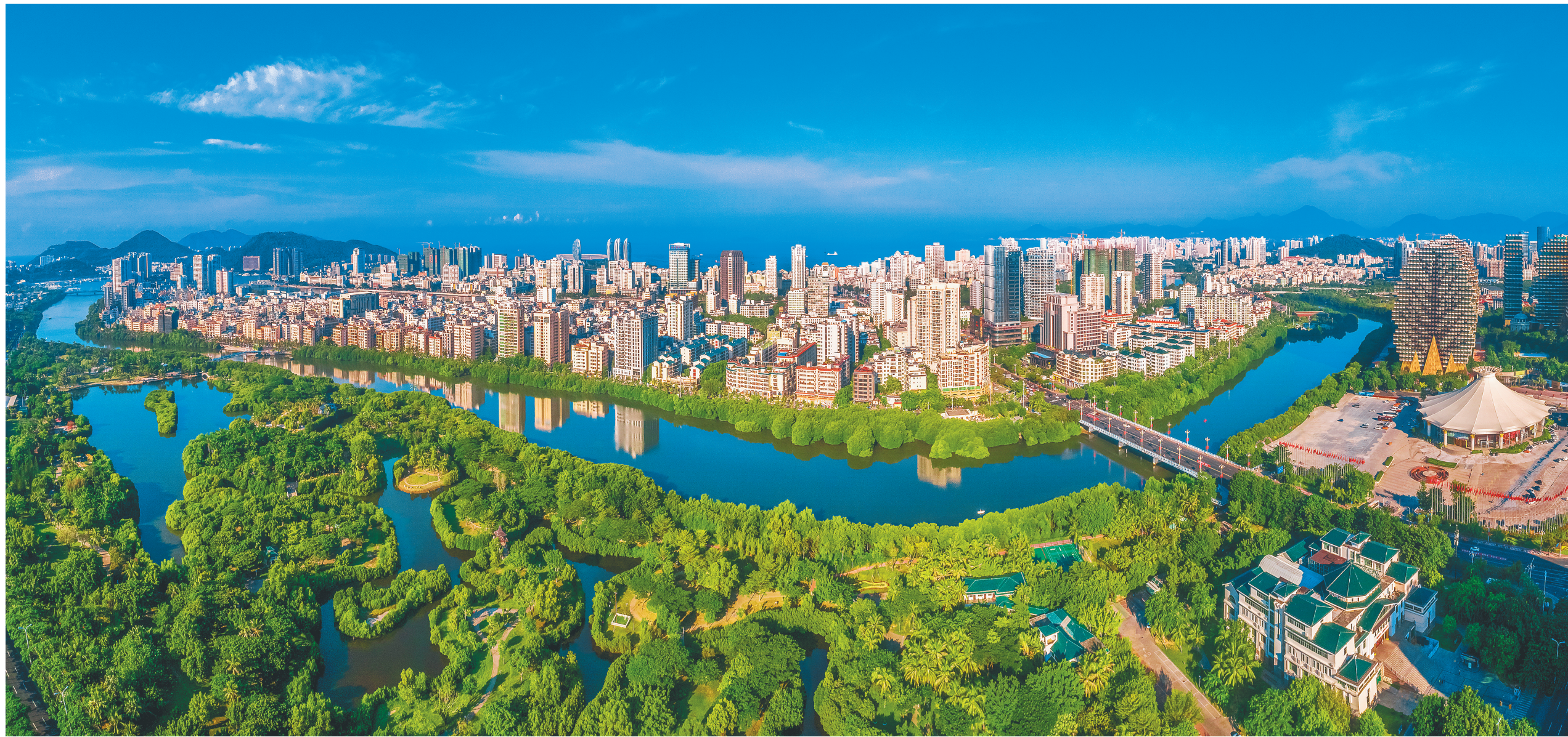
三亚市城区。