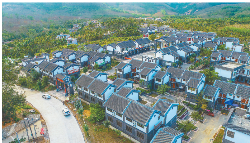
定安县母瑞山七队美丽乡村项目。