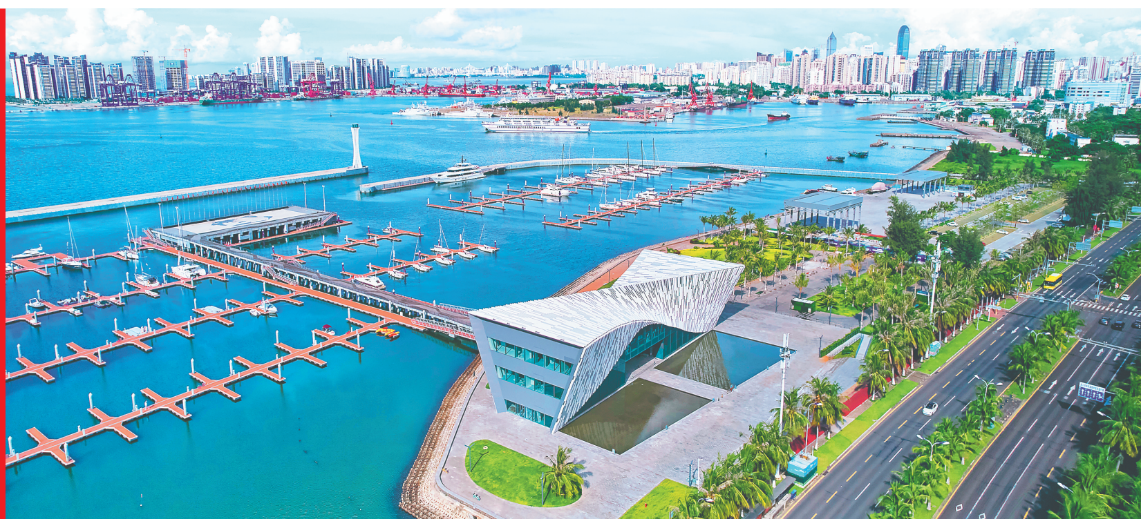
海口市国家帆船基地公共码头游客中心。