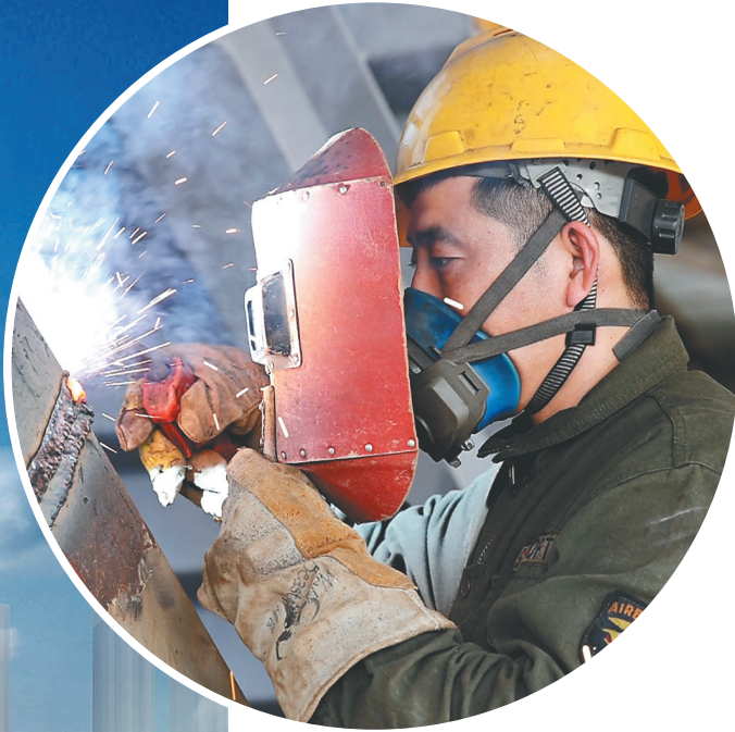
海口·中交国际自贸中心项目现场,工人正在紧张施工。