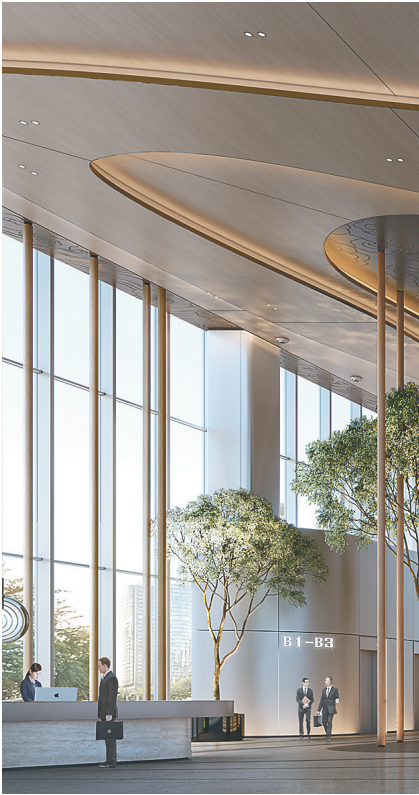
总部大楼大堂效果图。