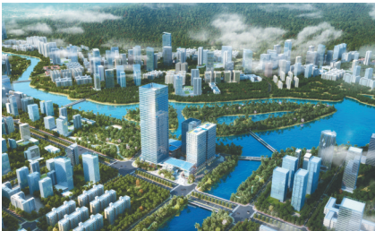
三亚中交国际自贸中心整体效果图。