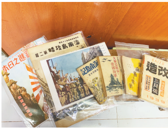
张鸿收藏的部分文献。