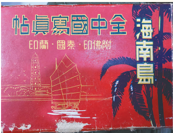
日军侵琼史料是张鸿最近7年专注的主要藏品。