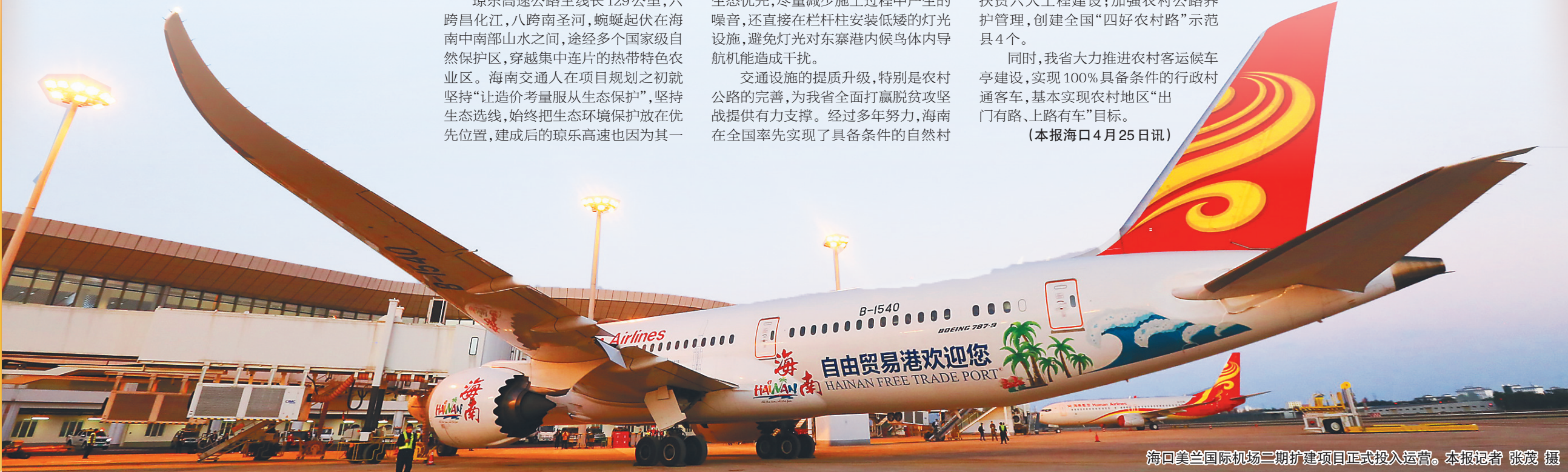
海口美兰国际机场二期扩建项目正式投入运营。