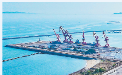
东方市八所港。