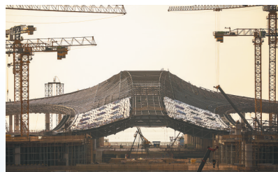
新海港客运综合枢纽项目加速推进。