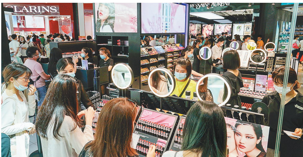
游客在三亚国际免税城购物。

三亚市有关负责人介绍,三亚将通过打造国际旅游消费中心核心区、自贸港现代服务业集聚区、国家战略高新技术前沿区、热带特色现代农业示范区、产业集聚发展样板区等“五大行动”,推动旅游产品业态升级,交易平台、保险业等金融业态集聚,推进南繁产业发展,开展种业“卡脖子”技术攻关,打造全国种业创新高地。三亚力争到2024年,实现重点产业增加值、产业投资规模突破千亿,建成2个营业收入超千亿元产业园区,实现产业能级、结构优化、创新动能、产业集聚、发展环境“五个提升”。